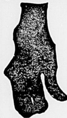
Difformité dans le rhumatisme chronique

Je vous enverrai gratuitement une boîte de 50 centins de mon remède