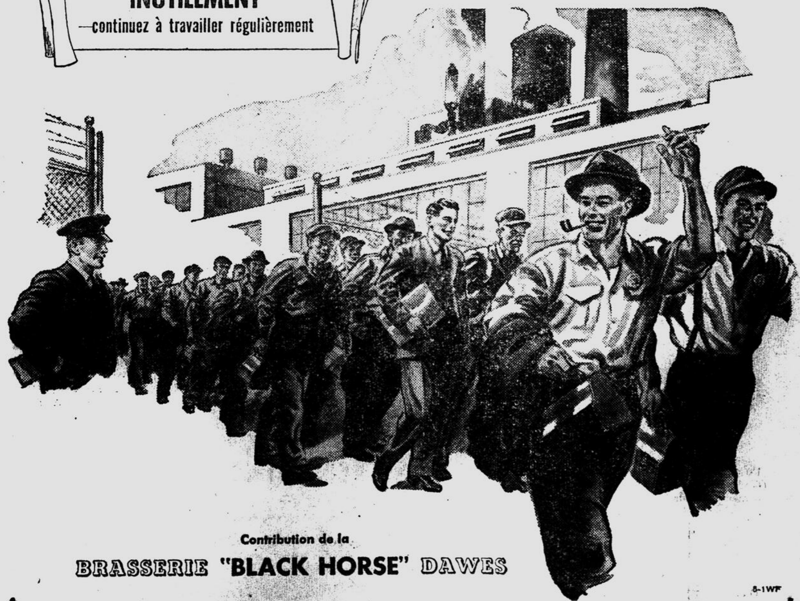
Contribution de la BRASSERIE "BLACK HORSE" DAWES

NE CHÔMEZ PAS INUTILEMENT —continuez à travailler régulièrement—