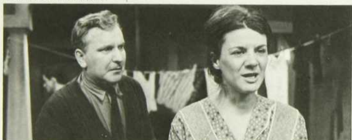
D'après Franz Schubert — La Jeune Fille et la Mort