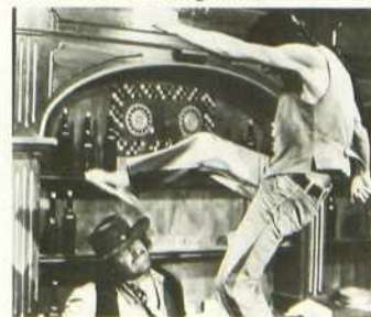
Mon nom est Shangai Joe

Selon les spécialistes du genre, Mon nom est Shangai Joe est un bon film de karaté dans le cadre de l'univers western. Tous ces ingrédients forment un mélange étonnant où l'humour et le mouvement le disputent à la couleur. C'est surtout la composition de Klaus Kinski qui retiendra l'attention des amateurs de films d'action.