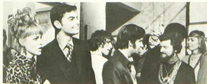
Le Journal intime d'une femme mariée

Ouvrier d'usine, Charlot est soumis au rythme implacable du travail à la chaîne. Un jour, il se décide de désorganiser le système. Il détraque la machine et s'en va poursuivre les passantes. Guéri, mais chômeur, il rencontre une petite orpheline. On le retrouve bientôt veilleur de nuit dans un grand magasin où il sera arrêté à cause d'un vol, survenu durant son service. A sa sortie de prison, son amie le fait engager dans un restaurant où elle travaille comme danseuse. L'orpheline sera arrêtée à son tour pour vagabondage, mais tous deux s'échapperont, bras dessus, bras dessous.