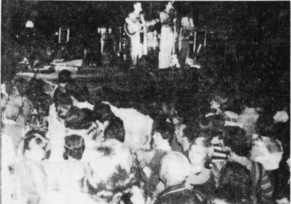
Cinq fardiers avaient été installés sur la rue Lindsay et sur chacune de ces estrades, des spectacles ont été présentés sans interruption toute la soirée. Les gens ont souligné l'excellence des numéros et de la qualité du son.

Les Fêtes de la St-Jean se poursuivent un peu partout pendant la prochaine fin de semaine. Ainsi demain, le 26, c'est au tour des Chevaliers de Colomb d'Acton Vale qui présente une kyrielle d'activités, dont l'une des plus remarquables sera la soirée folklorique avec Pierre Daignault (ex-père Ovide).