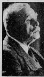
Bertram Brockhouse, neutron et de la technique de diffraction des neutrons.

Le prix Nobel de physique 1994 a été attribué conjointement hier par l'Académie suédoise des sciences au Canadien Bertram Brockhouse et à l'Américain Clifford Shull. L'Américain George Olah s'est