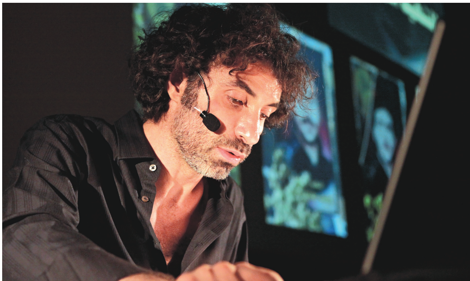
Le dramaturge libanais Rabih Mroué croit que « les nouveaux médias, le numérique, ne sont plus des supports, des prétextes, mais des composantes de la création ».

L'espace scénique serait propice à ce genre d'exercice réflexif et analytique, croit d'ailleurs le dramaturge montréalais Nicolas Berzi, dont les créations — Peep Show , bientôt représentée à La Chapelle, est l'une d'elles — explorent ces mutations sociales et narratives qui transforment actuellement les objets scéniques. « Les nouveaux médias, le numérique, ne sont plus des supports, des prétextes, mais des composantes de la création, dit-il. Ils influencent la façon de marquer la présence sur une scène, induisent des nouvelles formes d'écriture et offrent des nouvelles pistes de lecture, des traces qui changent les perspectives... sans doute pour le