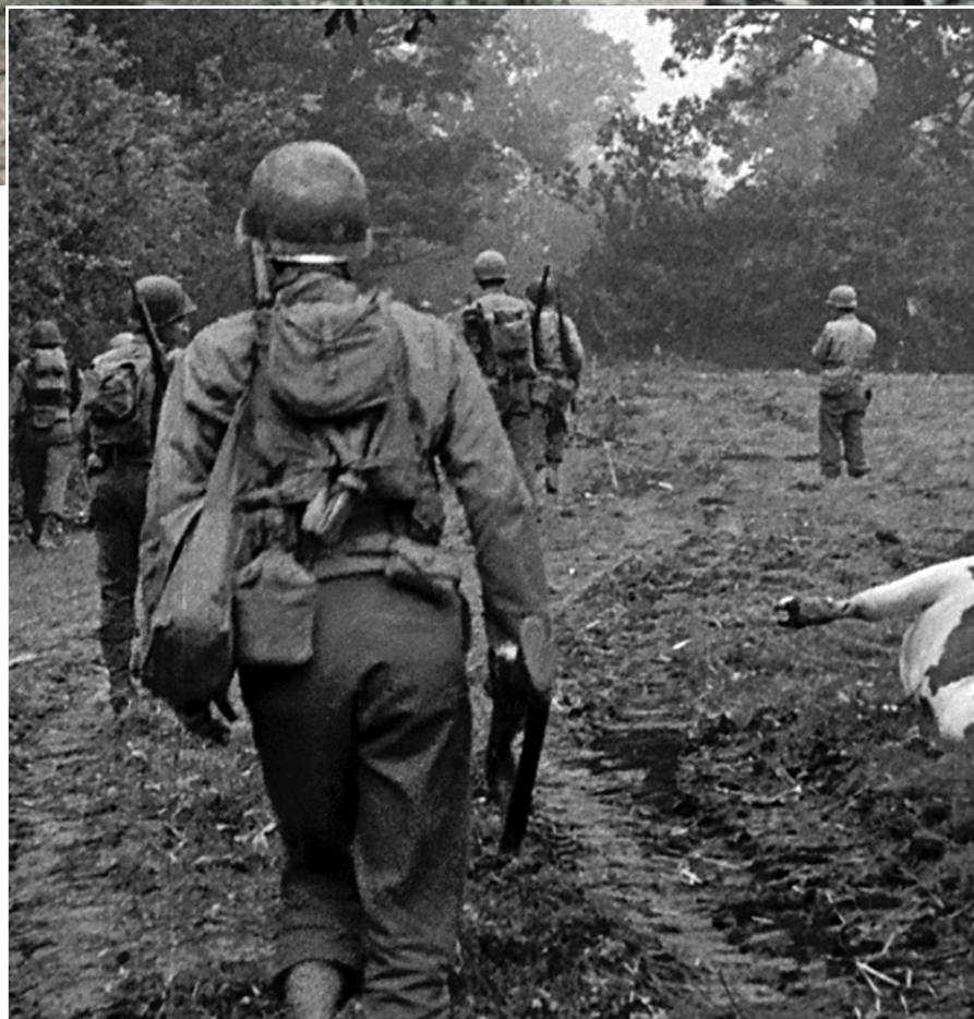
Photo de la Deuxième Guerre mondiale utilisée dans la série télé Sacrifice

« La façon de spectaculariser et de coloriser les images a été vue comme de la manipulation. On a retiré leur authenticité aux images pour les rendre plus attractives, notamment pour les jeunes. »