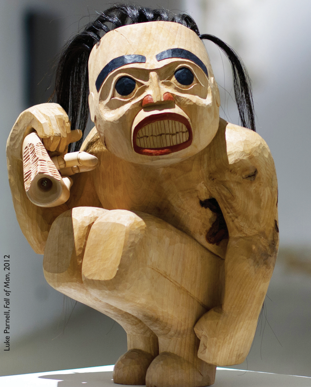
Luke Parnell, Fall of Man, 2012