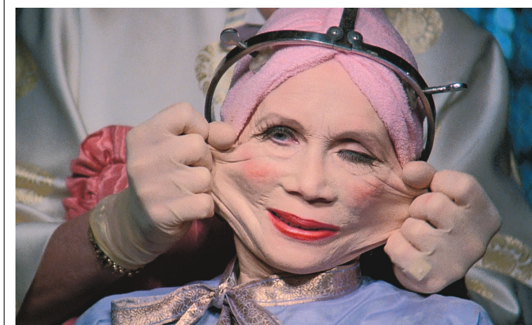
CINÉMA DU PARC