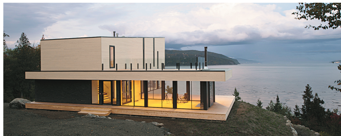
La grande boudeuse, une maison située dans la région de Charlevoix