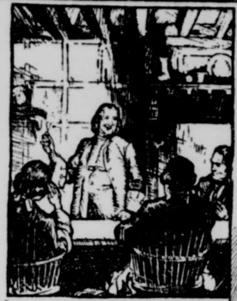
En 1762, alors que quelques artisans français, Jacques & Lambert se réu- nissent dans une bâtisse construite à l'Est de la Promenade de — à l'Est de — à l'Est de — à l'Est de