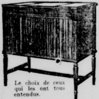
Le choix de ceux qui les ont tous entendus.