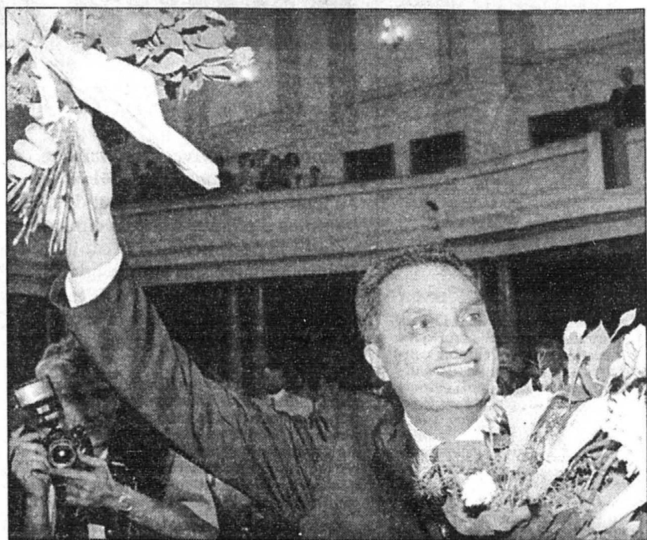
Le nouveau premier ministre Ivan Kostov, leader de l'Union des forces démocratiques, a été chaudement accueilli par ses partisans, hier, à Sofia.

Le directeur financier doit être accompagné d'une accélération de la privatisation et d'une restructuration de l'écono-