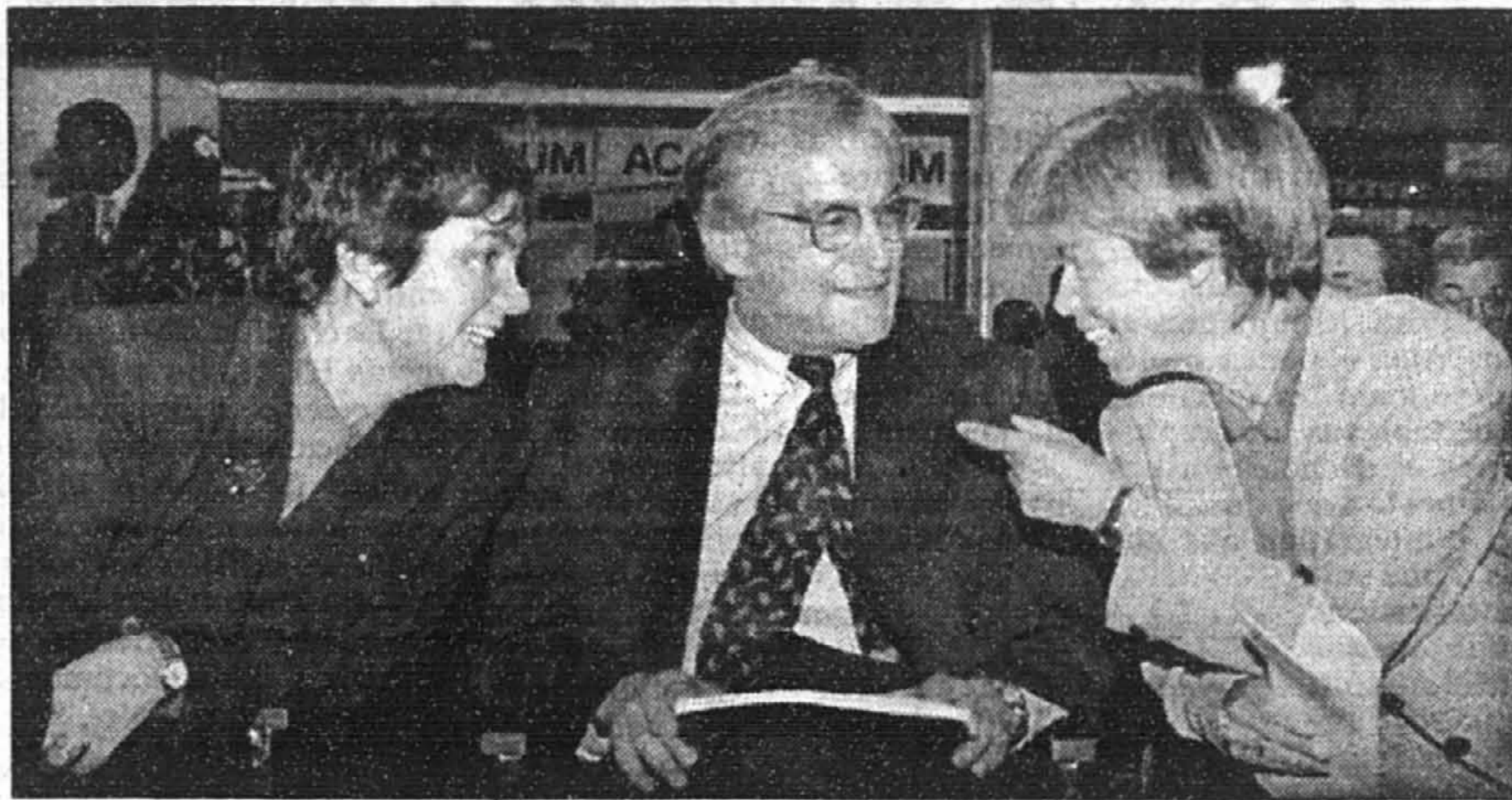
Mme Sheila Copps discute avec M. Jean-Louis Roy, secrétaire général de l'Agence de la Francophonie, et avec Mme Louise Beaudoin (à droite) dans le cadre de la Conférence des ministres francophones chargés des inforoutes qui a pris fin hier après-midi, à Montréal.