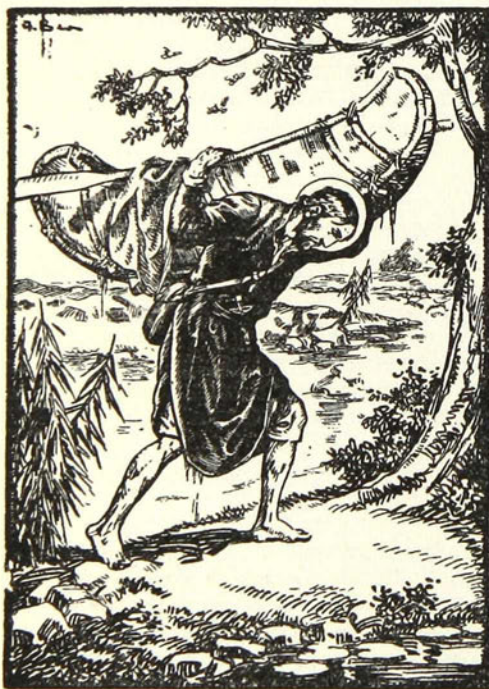
LES RUDES VOYAGES

sur sa passion et les détails de sa mort, parce que, dit l'Apôtre, il nous a rachetés par son sang. Mais le Christ, qui a versé son sang, demande la collaboration des baptisés qui constituent avec lui son Corps mystique. Les nations, comme les individus, doivent apporter leur part de souffrance et de sang à l'œuvre rédemptrice pour s'en voir appliquer les bienfaits. Avec cette énergie qui le caractérise, saint Paul l'apprenait à ses fidèles Colossiens : « Je me réjouis de