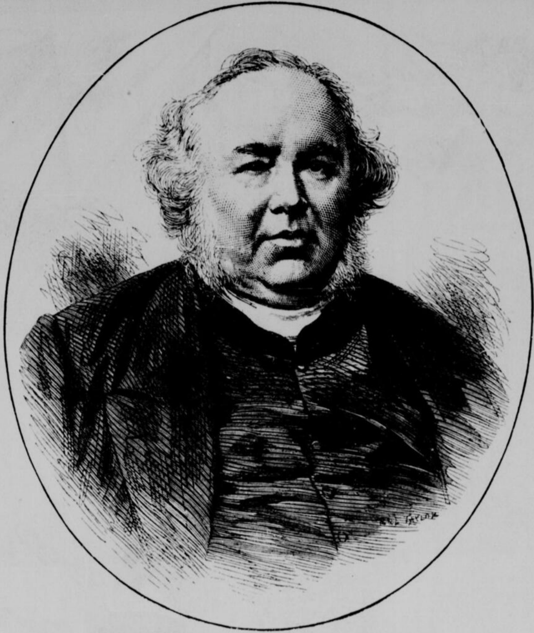
JULES JANIN, DÉCÉDÉ LE 19 JUIN