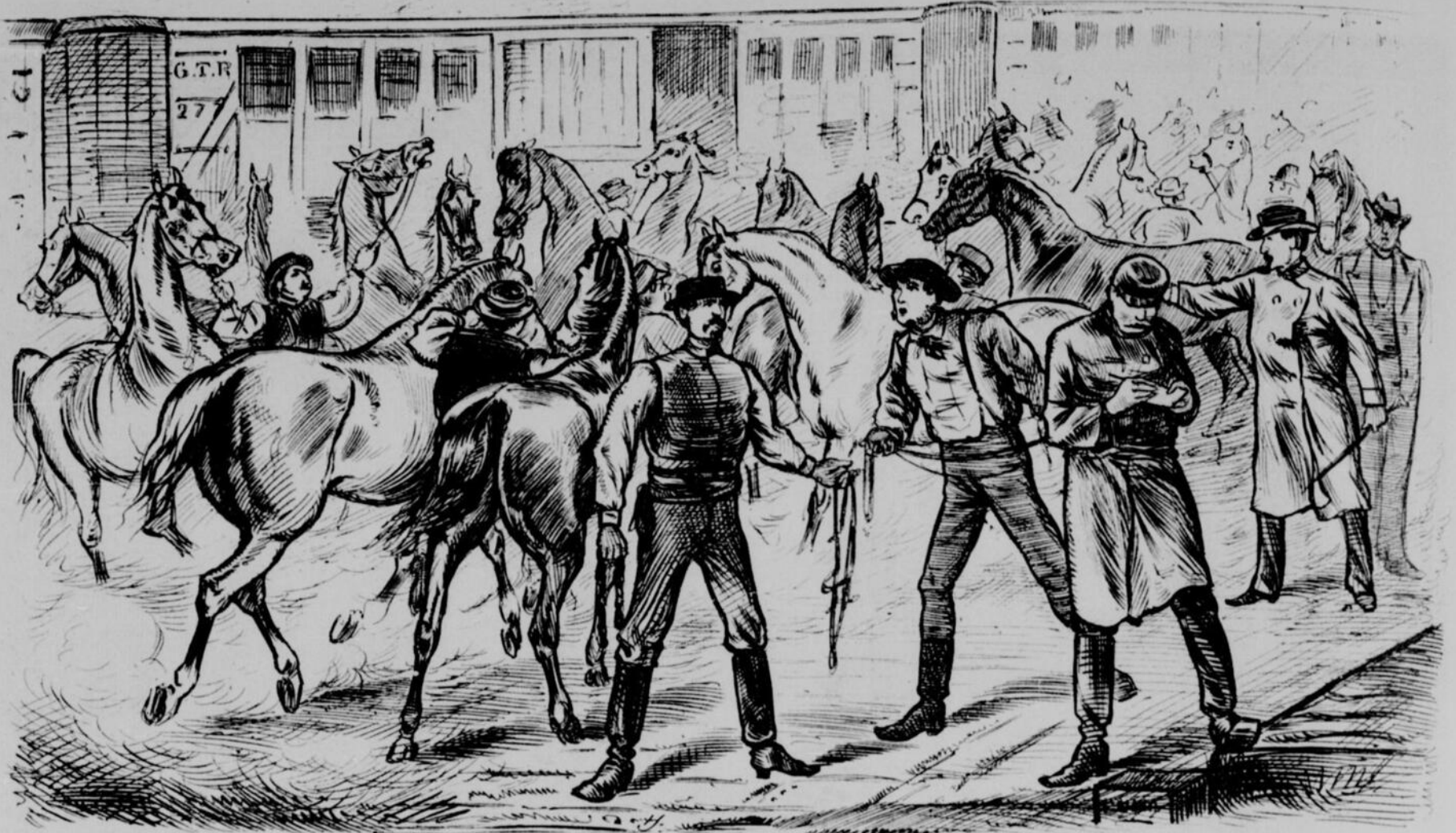
EMBARQUEMENT DES CHEVAUX DE LA POLICE DU MANITOBA, A TORONTO, LE 6 JUIN