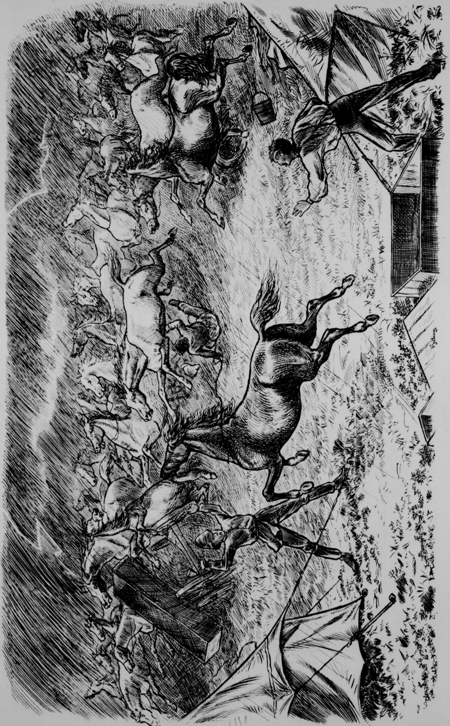
FANIQUE PARMI LES CHEVAUX DURANT LA TEMPETE DU 20 JUIN