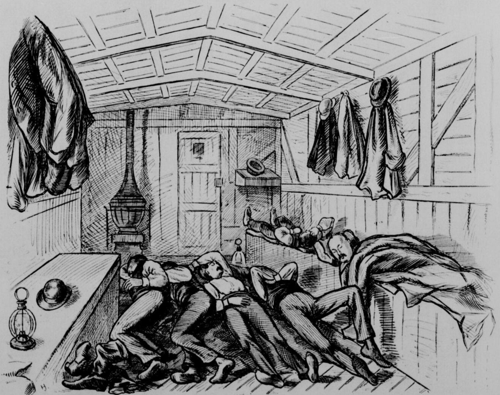
EN ROUTE POUR LE MANITOBA — WAGON DES OFFICIERS A 11h. P. M.