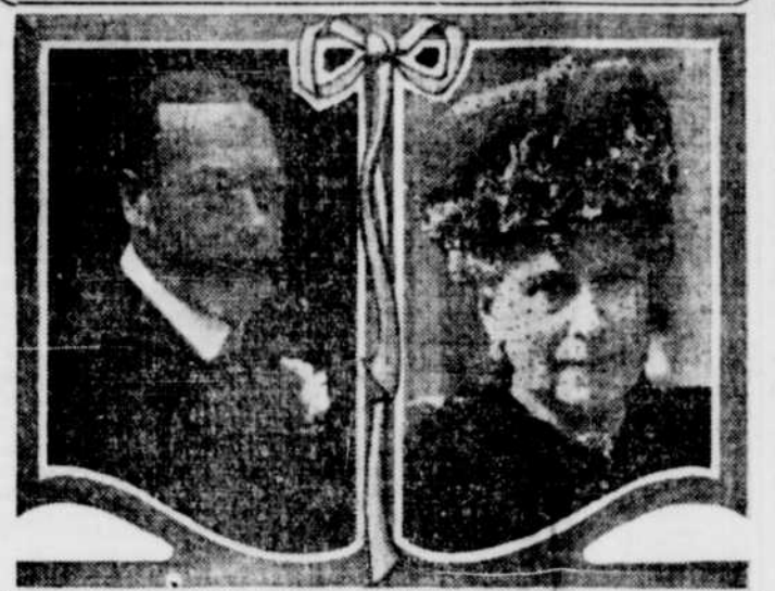
Le roi et la reine d'Angleterre, qui rendront visite au pape, le mois prochain