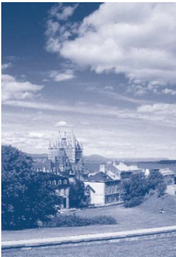
Jean-Guy Lavoie / Tourisme Québec

Le plan d'action de Tourisme Québec suit toutes ces pistes et propose des actions pour maximiser le développement touristique de la capitale nationale.