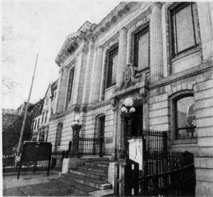
Plusieurs aspirants occupants de l'édifice Saint-Sulpice sont connus. De ceux-ci, aucun ne sait à ce jour où en est le dossier.