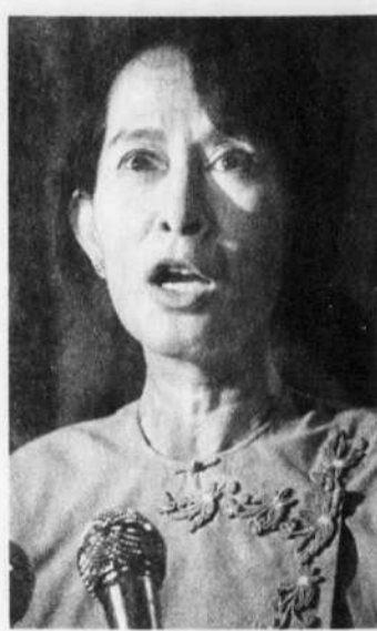
Aung San Suu Kyi

L'opposante, qui a salué la décision de l'administration Obama de rouvrir le dialogue avec les militaires de Naypyidaw, semble vouloir sortir de l'impasse dans laquelle se trouvent ses relations avec les militaires et, par voie de conséquence, celles entre la Birmanie et l'Occident.