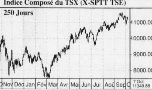
Indice Composé du TSX (X-SPTT TSE) 250 Jours