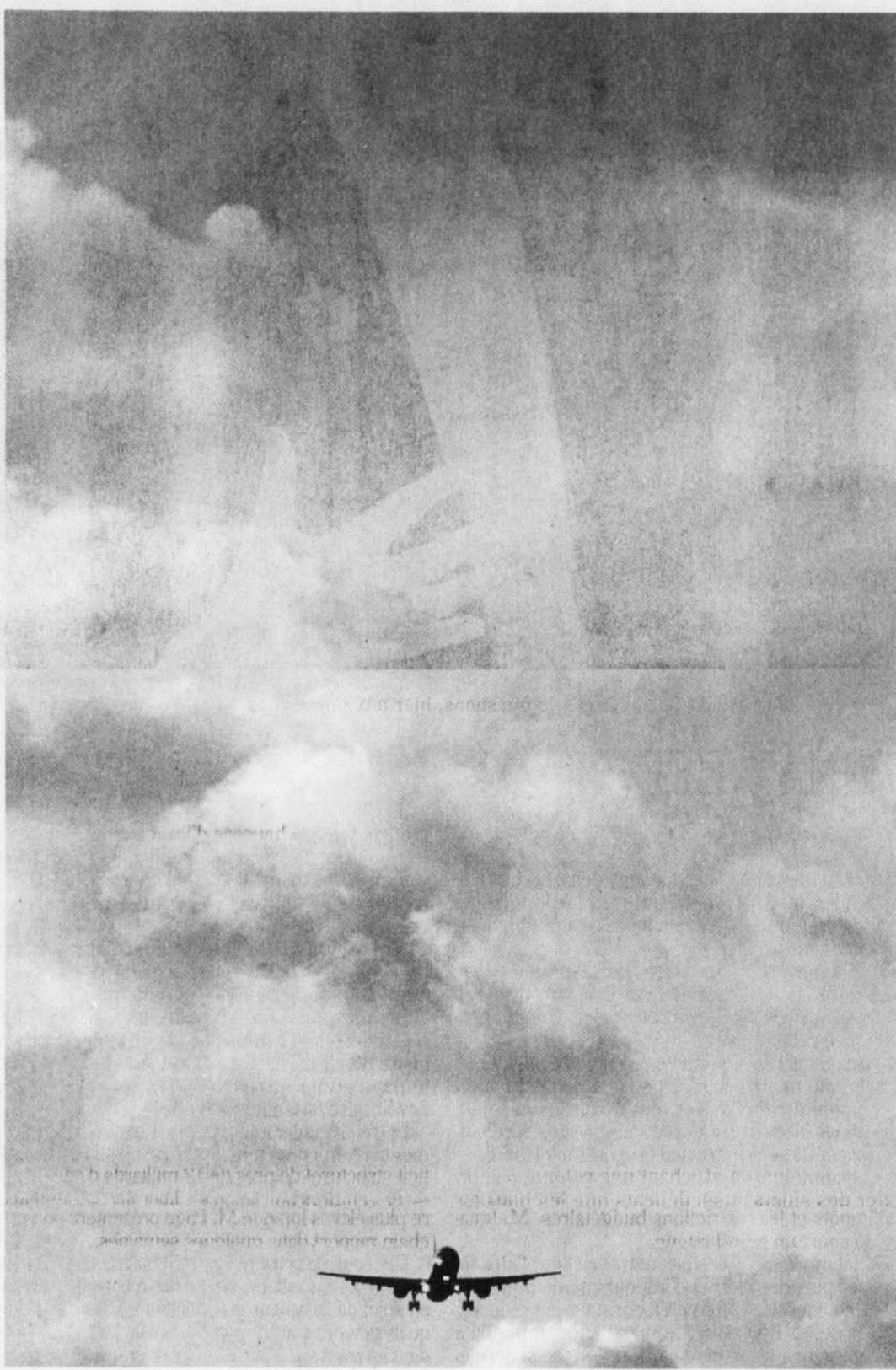
KIERAN DOHERTY REUTERS