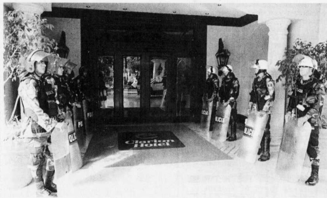
L'hôtel où se déroulent les pourparlers est sous bonne garde.

Téhéran — Le président iranien, Mahmoud Ahmadinejad, a déclaré hier que les négociations de Genève, le 1 er octobre, avec les puissances du groupe des Six ont été un «pas en avant». «Je pense que les négociations de Genève ont été un pas en avant. J'espère que nous allons avancer de la même manière pour avoir une coopération constructive afin de régler les grands problèmes dans le monde», a déclaré M. Ahmadinejad à la sortie du conseil des ministres. Il a également ajouté que les négociations de Genève constituaient «une opportunité de coopération» entre l'Iran et les puissances du groupe des Six. — AFP