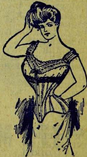
MODELES LES PLUS NOUVEAUX.

Les Dames qui insistent pour avoir les Crompton ne le regrettent jamais.