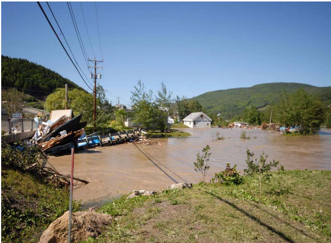
Amoncellement de débris sous un pont