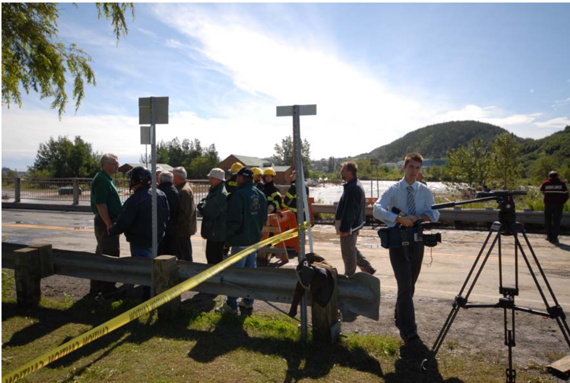
Citoyens, partenaires en sécurité civile, pompiers et médias s'informent des événements