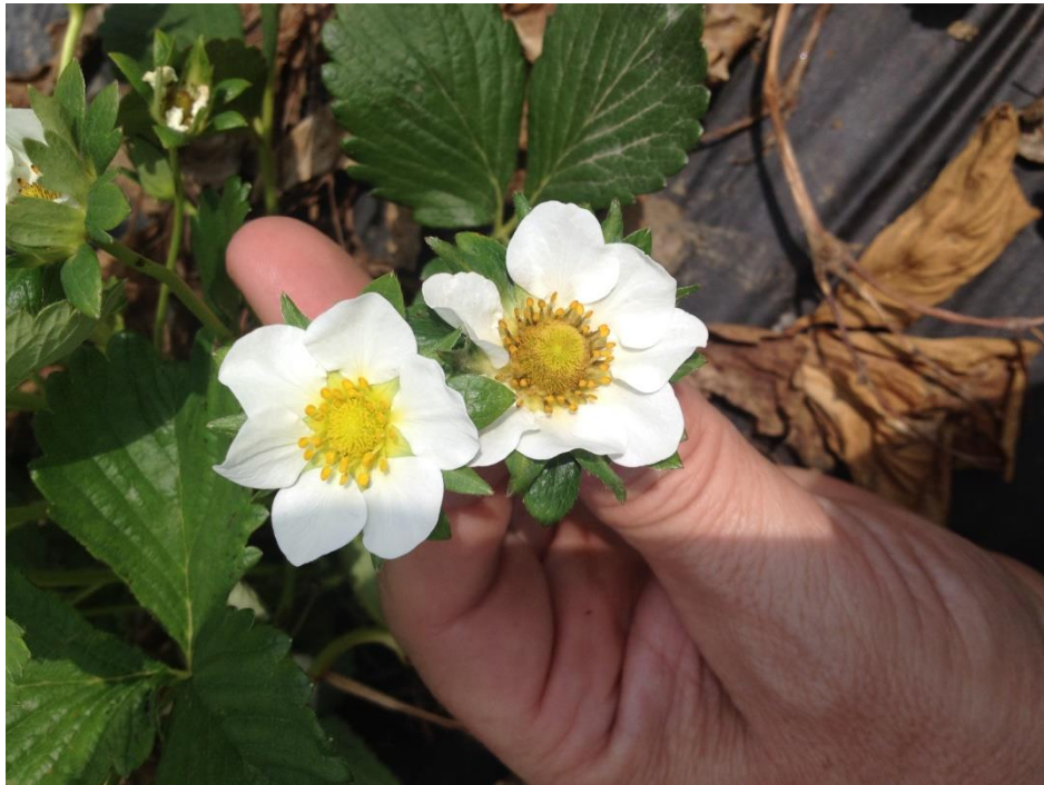
Photo : Fleur saine d'une coloration jaune clair (sans activité de thrips) et fleur d'un jaune plus brunâtre (avec activité de thrips)

Lorsque les thrips s'alimentent sur les fleurs, il est possible de voir un changement de la coloration de la fleur qui devient plus brunâtre.