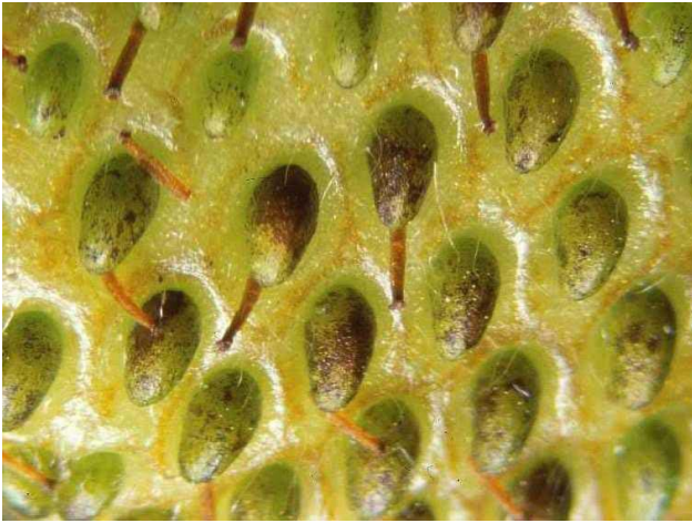
Dégâts de thrips sous les akènes