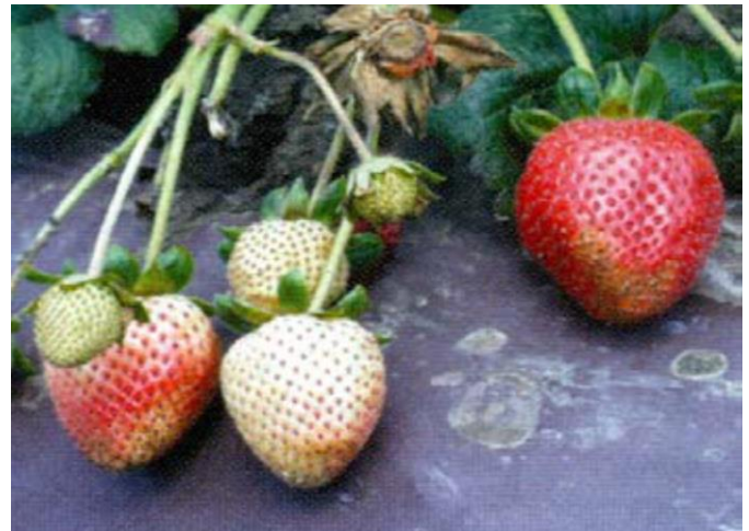
Bronzage associé à une phytotoxicité ou au frottement Source : Koike et collab., 2009

Source : Thibault, P., 2011, Un « thrips » de fraise, Journées horticoles Saint-Rémi