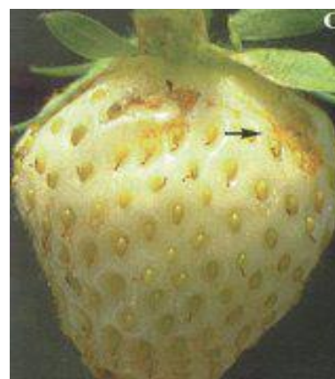
Symptômes de bronzage sous les sépales à l'abri du soleil Source : http://www.gnb.ca

Fortes populations + Séquence de chaleur + Historique de dommages + Régie de production avec plastique et/ou couverture flottante.