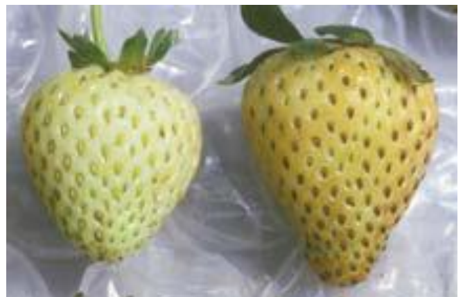
Bronzage associé aux stress climatiques Source : Koike et collab., 2009

Source : Thibault, P., 2011, Un « thrips » de fraise, Journées horticoles Saint-Rémi