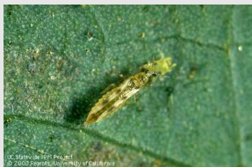
Thrips bénéfique : six-spotted thrips.

Ce ne sont pas toutes les espèces de thrips qui sont des ravageurs. Certains thrips sont des prédateurs et peuvent être observés dans les fraisières. C'est le cas de Scolothrips sexmaculatus ou « six-spotted thrips » qui, comme son nom l'indique, peut être différencié par la présence de six marques grises sur son abdomen. Cette espèce se nourrit principalement de tétranyques.