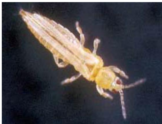
Thrips des fleurs ( Frankliniella tritici )

Les thrips sont des insectes de très petite taille (1 à 1,5 mm de long) qui peuvent prendre différentes teintes. En cas de doute, n'hésitez pas à envoyer des spécimens au Laboratoire d'expertise et de diagnostic en phytoprotection du MAPAQ.