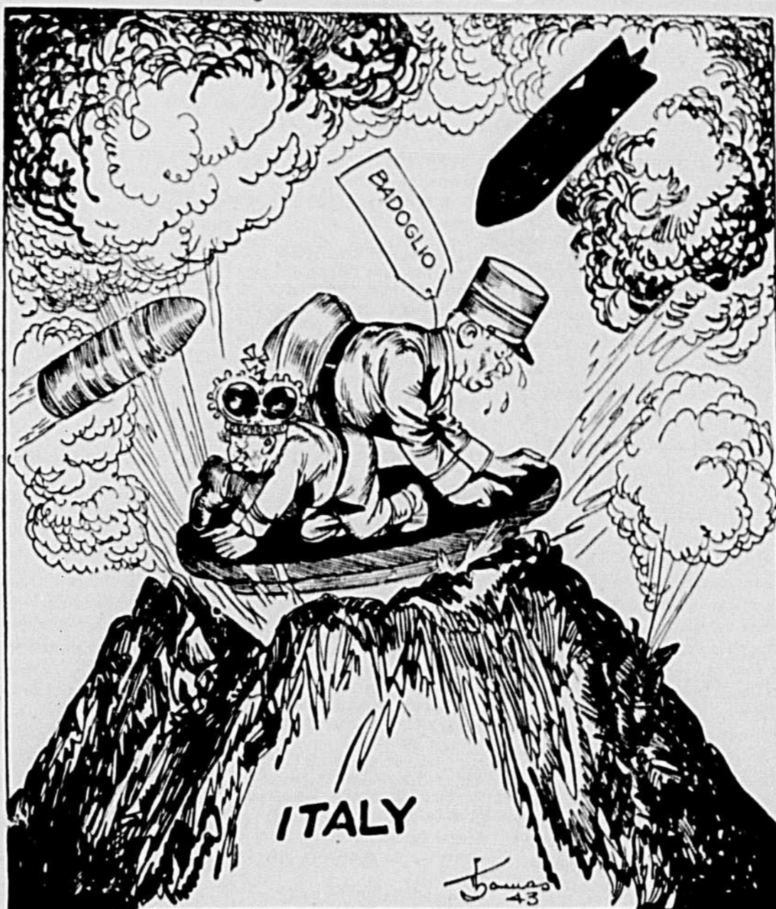
Le char de l'Etat navigue sur un volcan de flamme!