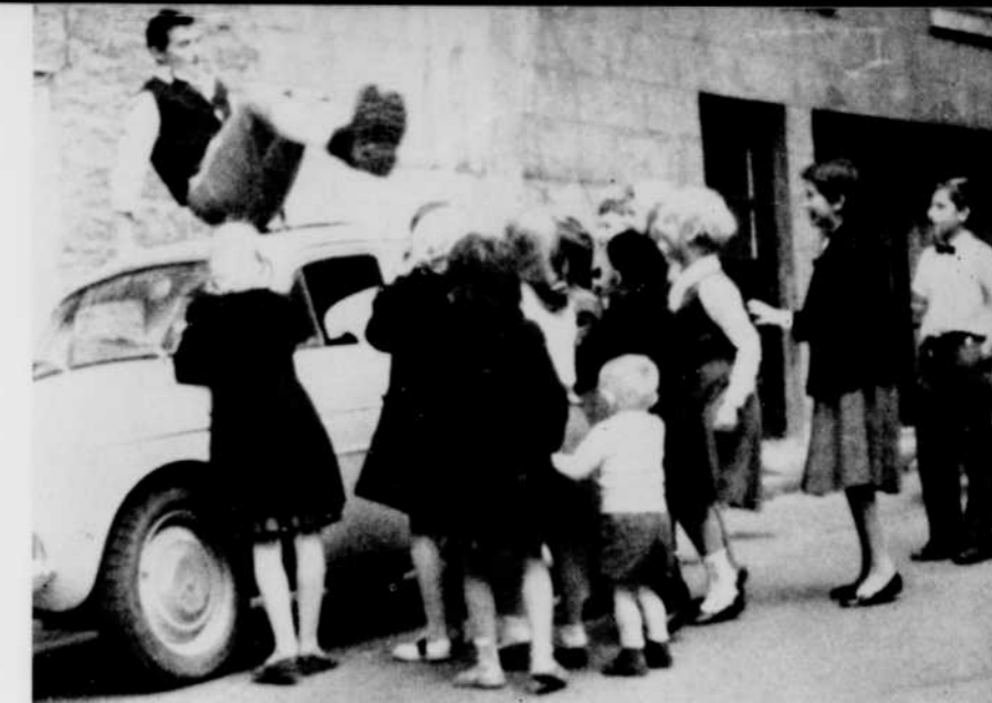
Sautapic saute à pic...