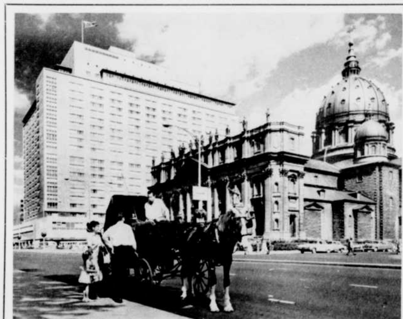
Voici bien un curieux et pittoresque spectacle que cette calèche arrêtée sur un des boulevards ordinairement les plus encombrés de Montréal. De cette vie intense de la Métropole, deux émissions entretiennent les auditeurs de Radio-Canada : CBF Métropolitain, tous les matins de la semaine, de 6 h. 05 à 8 h. 30, et Métro-magazine, de 4 h. 30 à 5 h. 30.