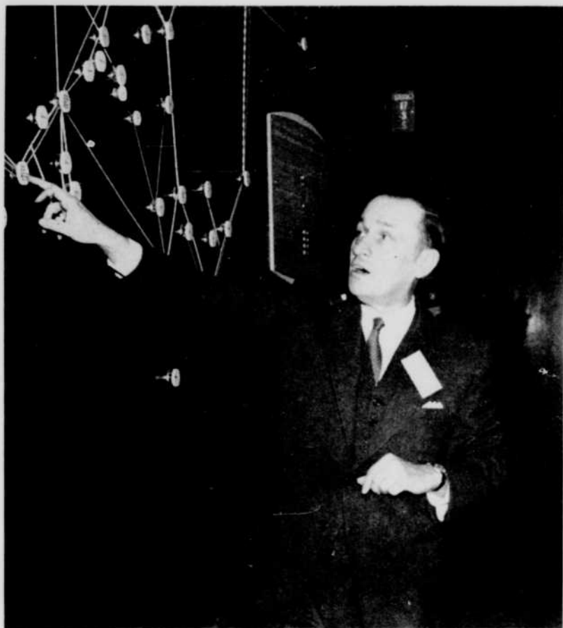
M. ALPHONSE OUIMET, président de la Société Radio-Canada, regarde ici la carte des réseaux de radio et de télévision qui se trouve dans le hall d'entrée de l'édifice de Radio-Canada à Montréal, carte à laquelle viendront bientôt s'ajouter de nouveaux postes-relais pour la radio.