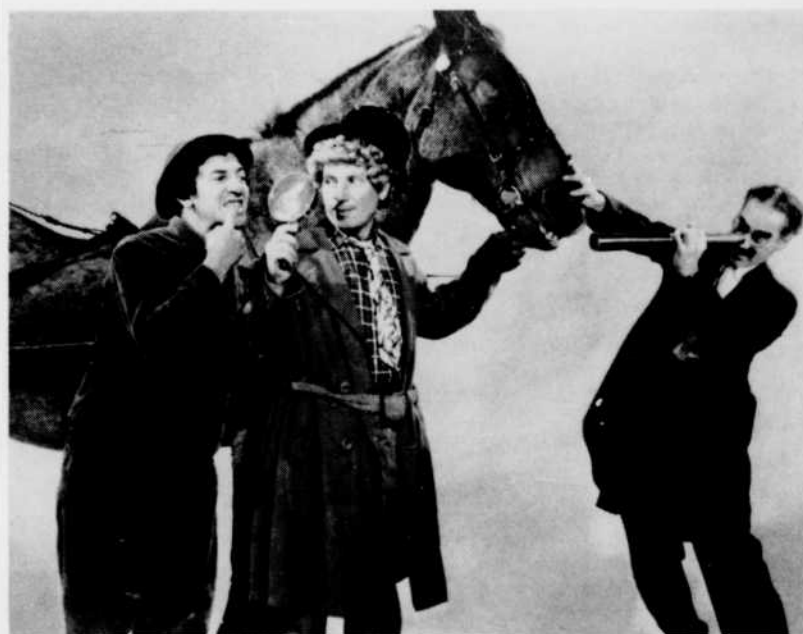
En 1936, les frères Marx tournaient un de leurs plus grands succès, A Day at the Races. Ce film sera présenté à Great Movies, série du réseau anglais de télévision, le samedi 27 août. On voit ici Chico (à gauche), qui donne des "tuyaux" à Harpo (au centre) et à Groucho (à droite). Nous pouvons penser que les choses n'en resteront pas là !