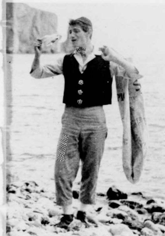
Si c'était une agate !

— Précisons tout d'abord que c'est le comédien Filden qui joue le personnage de Sautapic. Le but de la série est de faire une sorte de géographie humaine du Canada à l'échelle des enfants de 5 à 8 ans.