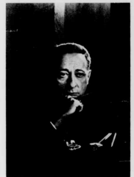
JASCHA HEIFETZ jouera à l'Heure du concerto, dimanche à 9 h. 06 du matin.