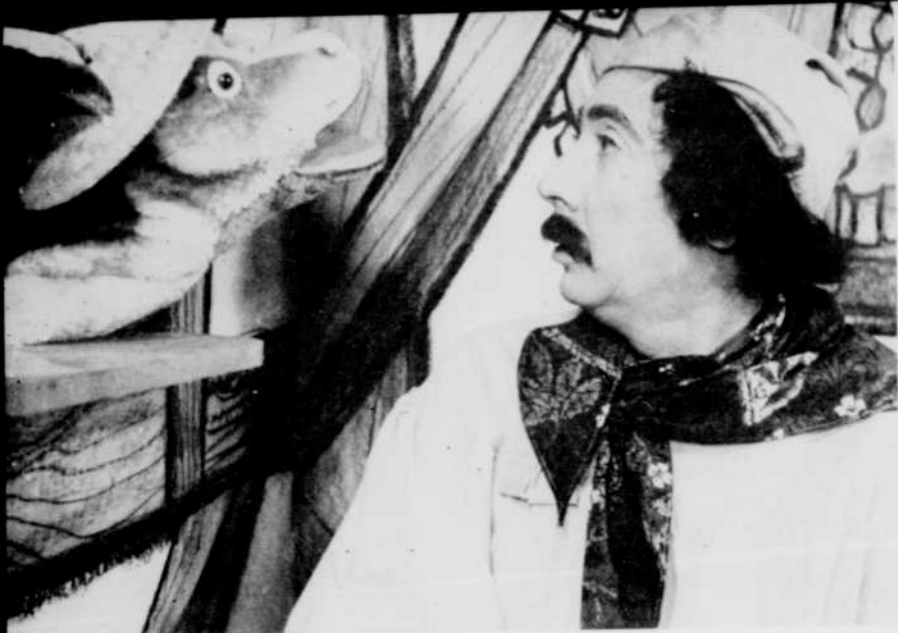
La musique mettra fin à la discussion.