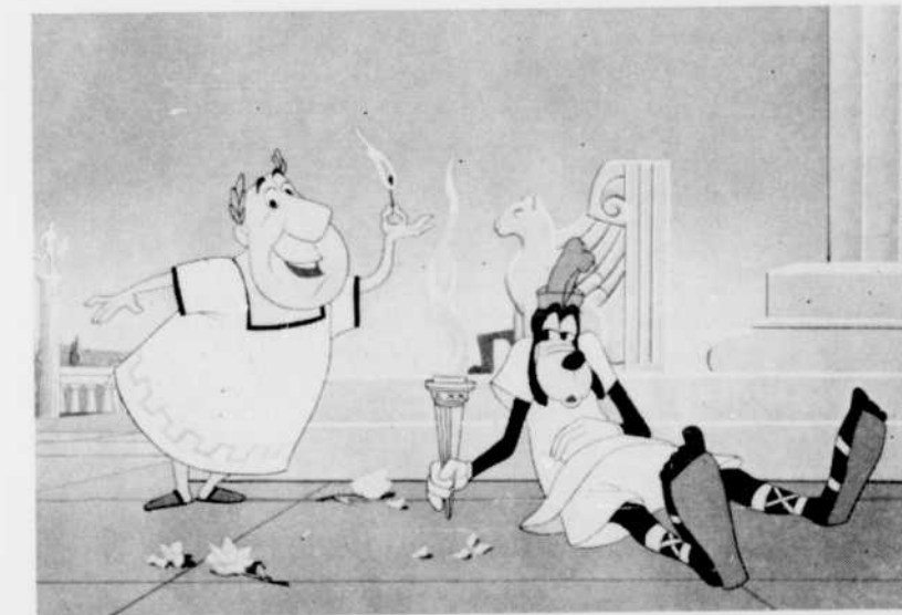
GOOFY, heureusement, reçoit des conseils sur la manière de garder allumé le flambeau des Jeux Olympiques. C'est un personnage nommé Spyros Olympopolus qui assiste notre ami. On verra cette scène, le samedi 27 août à 5 heures, à l'émission Walt Disney présente. L'épisode s'intitule Goofy, le sportif.