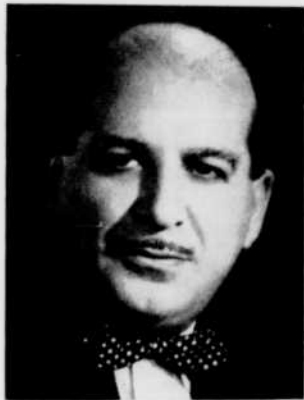
RENÉ ARTHUR auteur des textes de la série Quand l'opéra se donne des airs, le samedi matin à 11 heures.