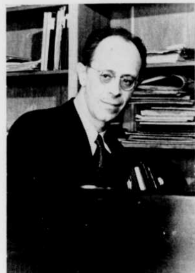
RUDOLF SERKIN, pianiste autrichien, jouera aux émissions Concert de 11 h. 10, lundi et mardi.