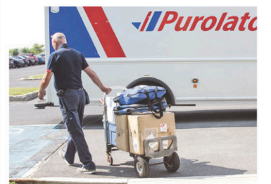
MICHAËL MONNIER LE DEVOIR