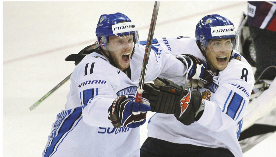
Les Finlandais Saku Koivu et Teemu Selanne seront intronisés au Temple de la renommée de l'IIHF.