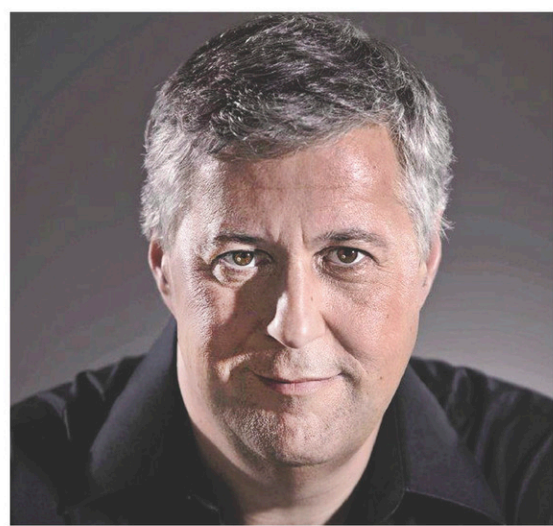
« Le moment est arrivé d'avoir d'autres types de rendez-vous à la télé », a souligné Paul Arcand.

En France, l'émission originale avait reçu des personnalités comme Gérard Depardieu, Omar Sy, Manuel Valls, Vincent Cassel ou l'homme d'affaires Arnaud Lagardère.