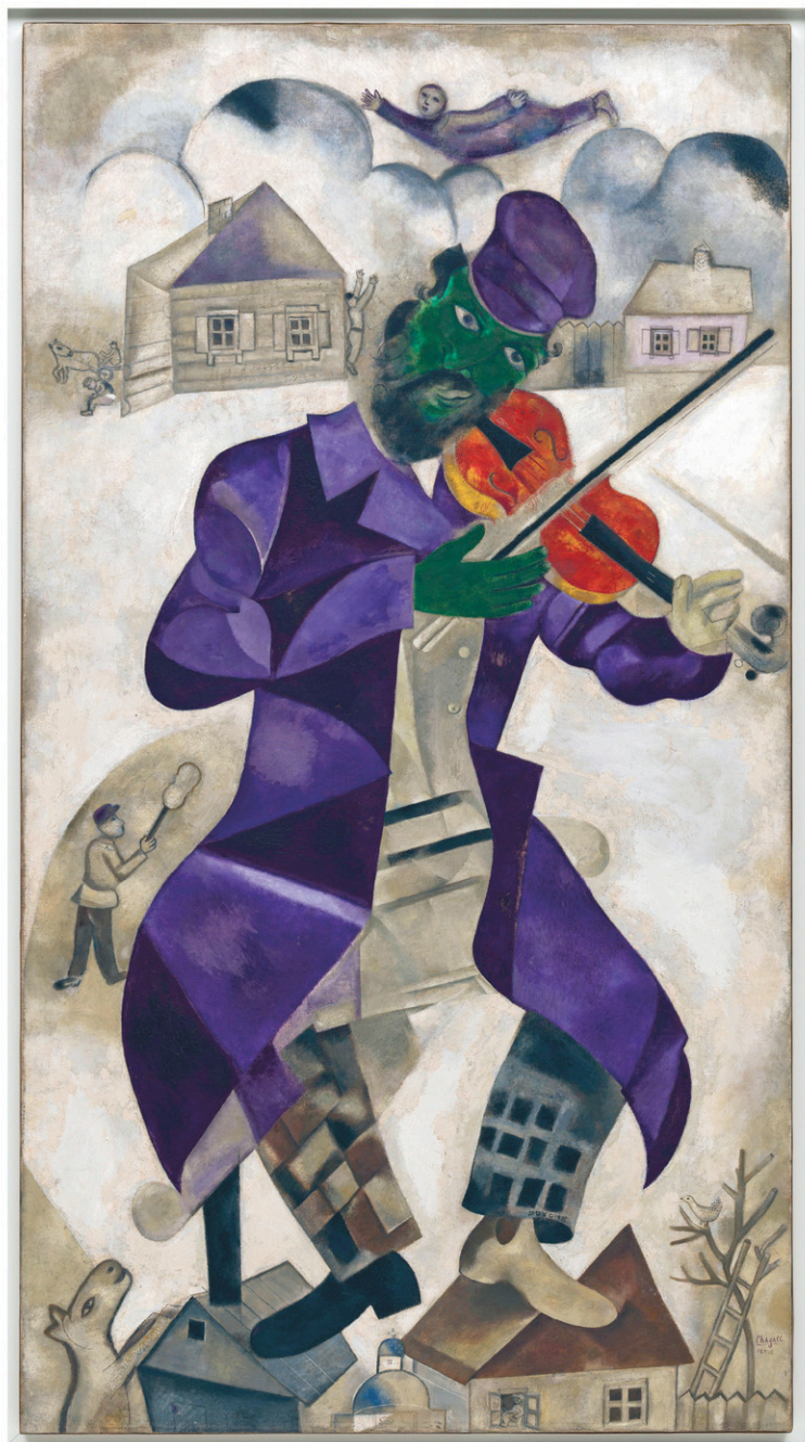
NEW YORK, SOLOMON R. GUGGENHEIM MUSEUM

Le tableau, daté de 1923-1924, porte non seulement la gravité de la mémoire, mais aussi le fantasme d'une totale liberté. « C'est un tableau qui est à la fois ancré dans la tradition, avec ce violoniste klezmer incarnant ses racines, et