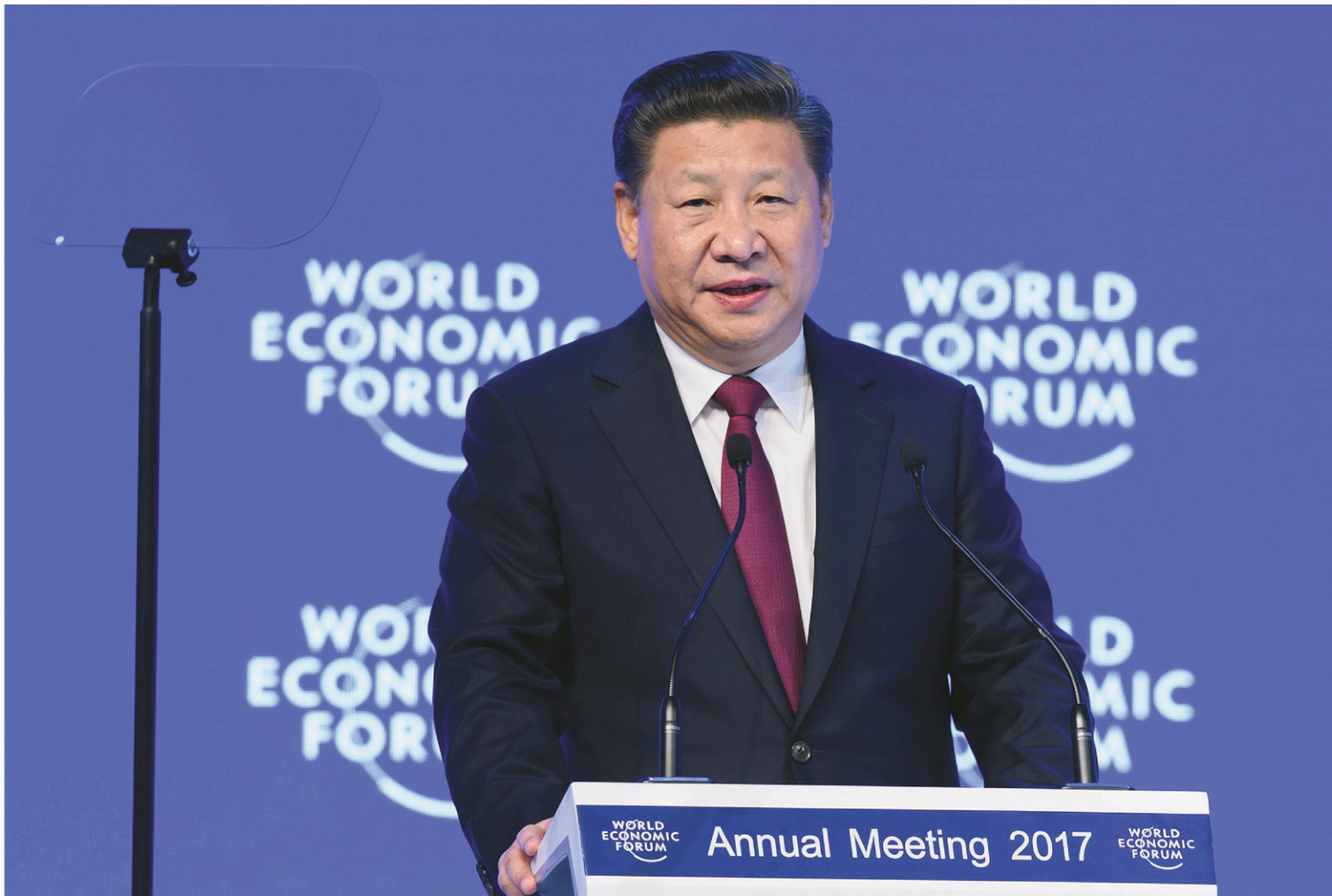
Xi Jinping est le premier chef d'État chinois à participer au Forum de Davos.