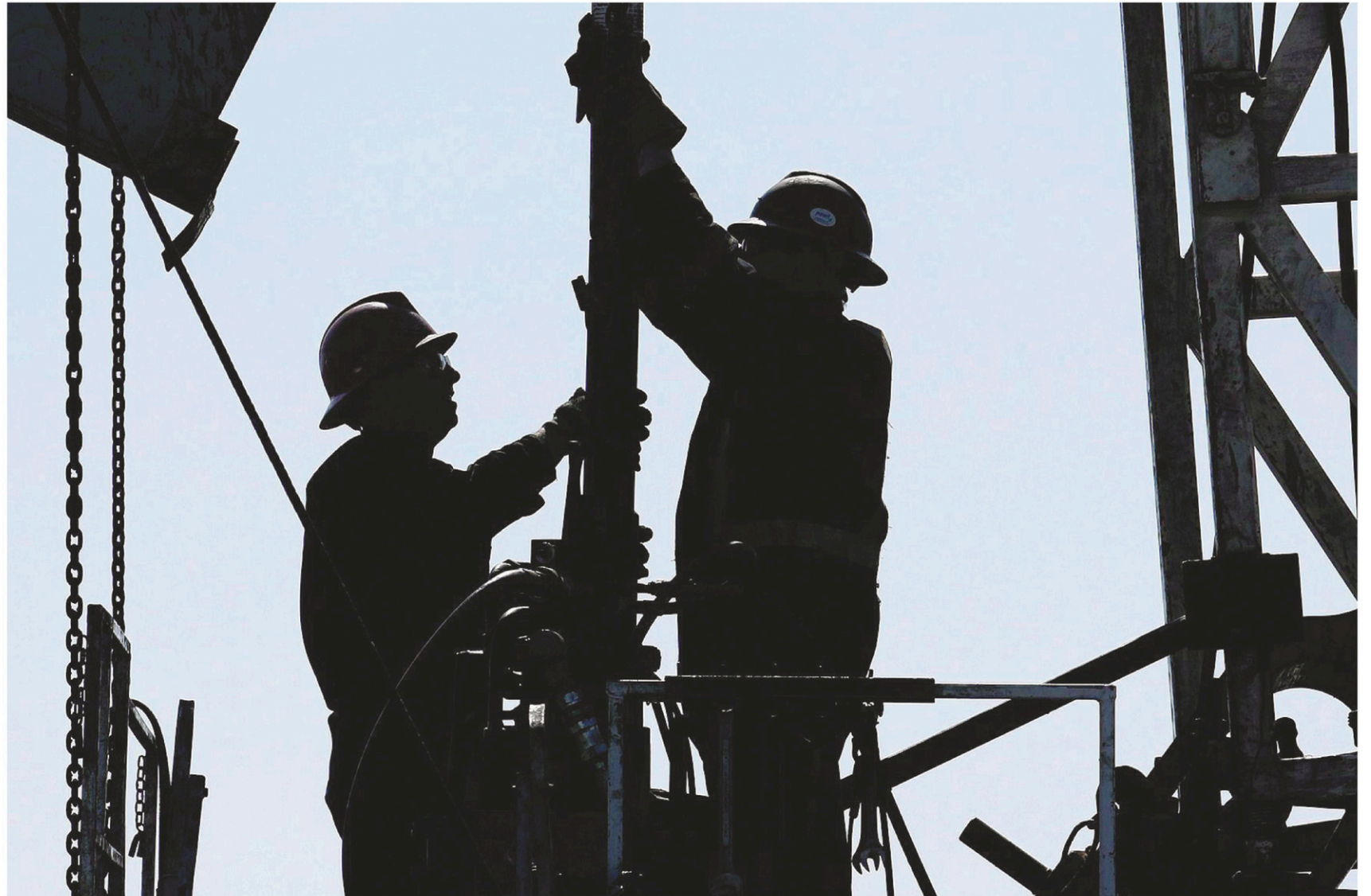
LARRY MACDOUGAL LA PRESSE CANADIENNE

Enbridge, l'entreprise albertaine spécialisée dans le transport du pétrole, est l'une des rares compagnies d'ici à apparaître au classement.