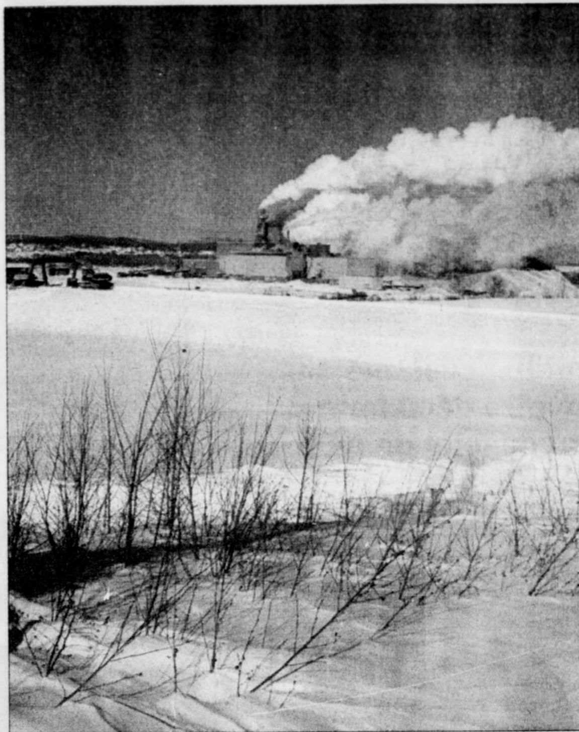
On aperçoit, à gauche, les travaux en cours pour le traitement secondaire des effluents de l'usine.