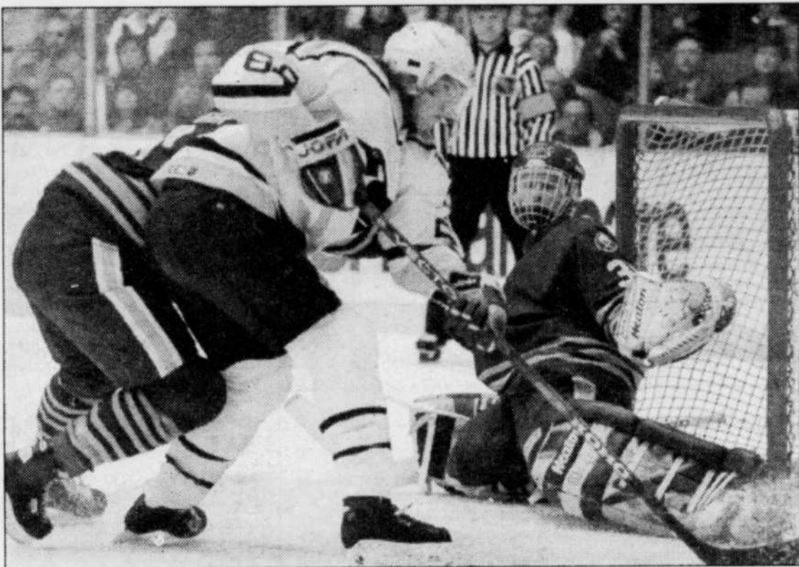
Un poison autour des buts, Jaromir Jagr des Penguins fait ci-dessus la vie dure à Dominik Hasek, gardien des Sabres de Buffalo, au cours du match de dimanche à Pittsburgh.

que Clark dans la Ville reine. Il sait très bien ce qu'il peut faire sur une patinoire. «Le mot intimidant est celui qu'on entend le plus quand il est question de Wendel, a-t-il confié. Des gars comme Probert et McSorley ont toujours un peu plus d'espace pour manoeuvrer sur une patinoire en raison de leur style de jeu. Eh bien imaginez la même chose avec Wendel. Mais en plus, il possède un talent fou. La combinaison est épeurante pour tout le monde. Le plus heureux sur la terre doit être Joe Sakic parce que c'est incroyable ce que Wendel peut accomplir pour bien faire paraître ses coéqui-