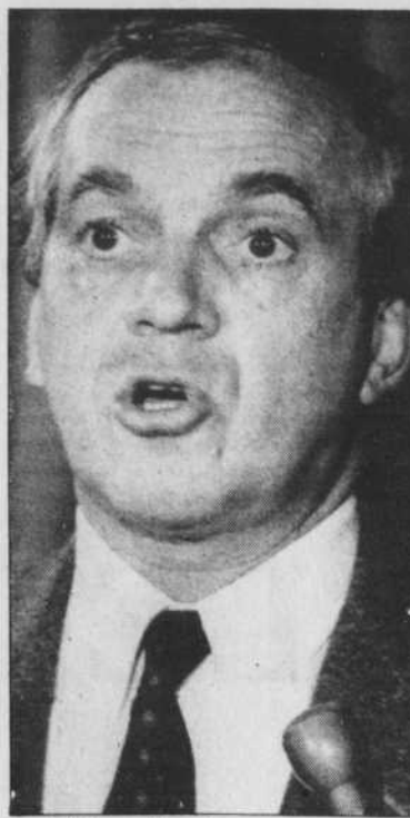
M. Ed Broadbent