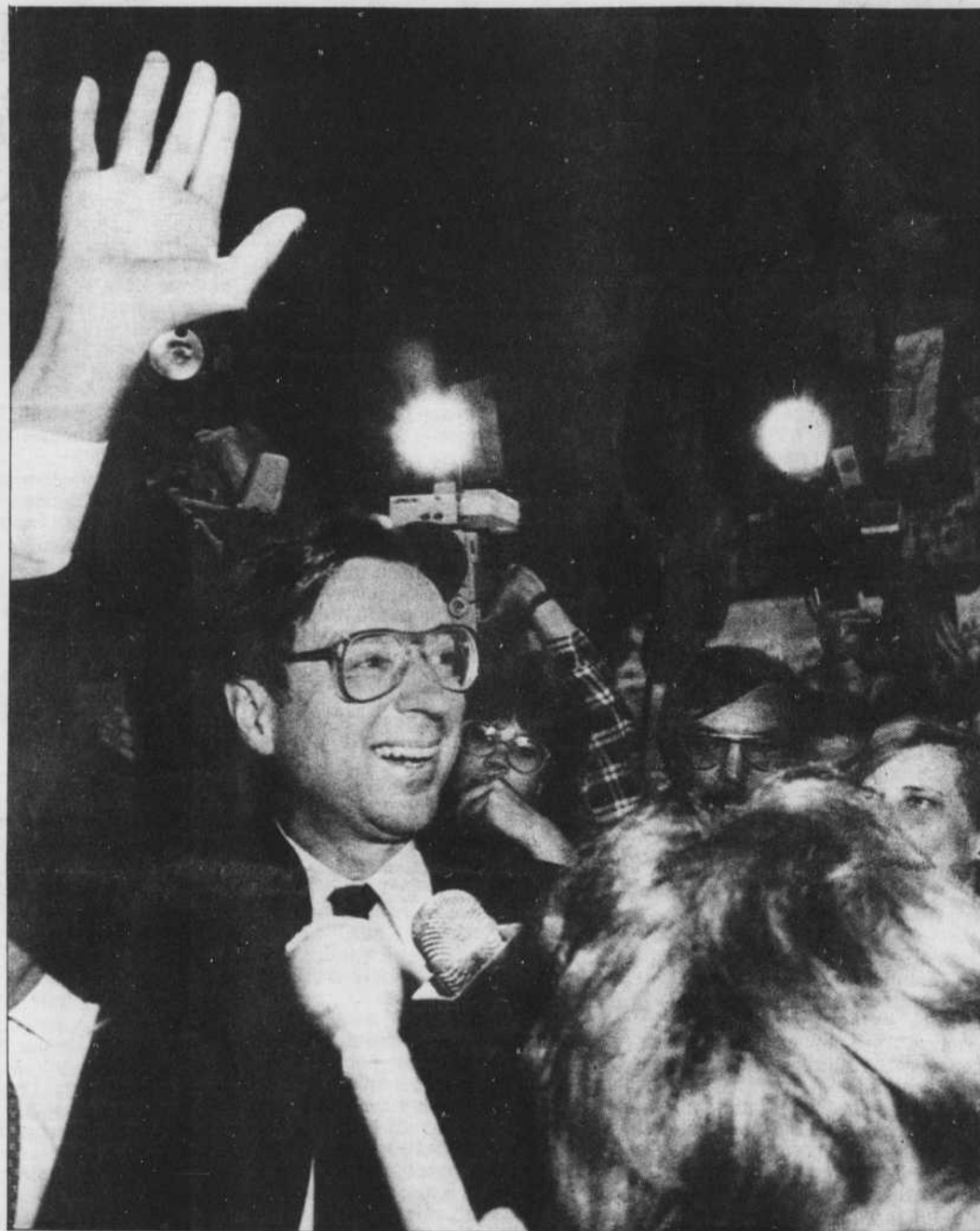
Le chef du Parti libéral du Québec, M. Robert Bourassa, affiche le sourire de la victoire, même si une ombre persiste, sa défaite dans son propre comté de Bertrand.