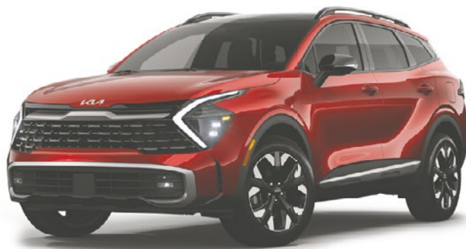
Le Sportage X-Line Limité 2023 redessiné

Réservez dès aujourd'hui chez votre concessionnaire.