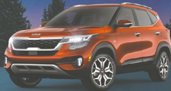
Le Seltos SX Turbo traction intégrale 2023