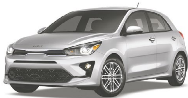
La Rio EX Premium 2023

Réservez dès aujourd'hui chez votre concessionnaire.