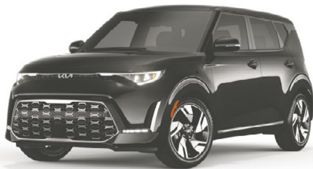
La Soul GT-Line Limitée 2023 redessinée

Réservez dès aujourd'hui chez votre concessionnaire.