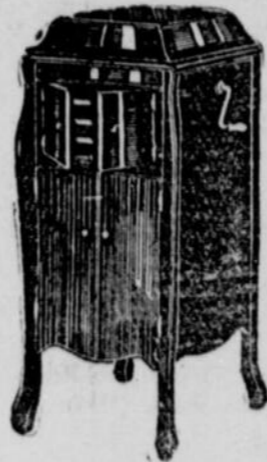
VICTROLA X, $185 Mahogany or Oak

Egg-O Baking Powder Co., Limited Hamilton, Canada