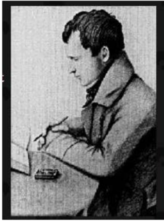
Fig. 1. CHEVALIER DE LORIMIER.

Prison de Montréal, 14 février 1839, à 11 heures du soir.