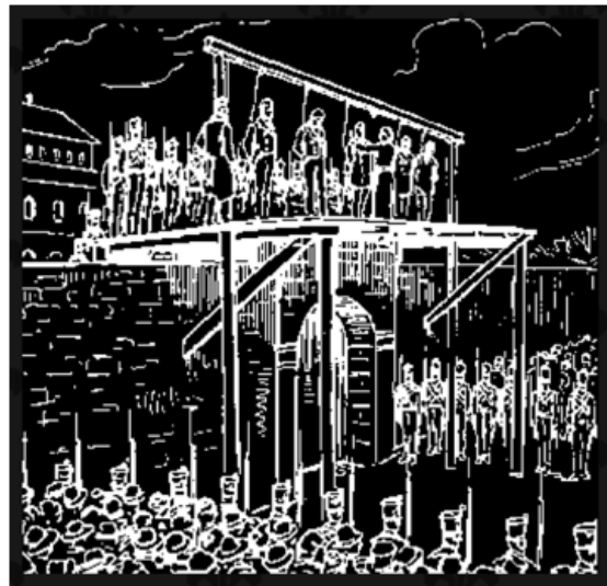
Fig. 2. Le 15 février 1838.