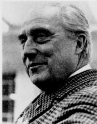
Propos et confidences mardi 7, 22 h 00