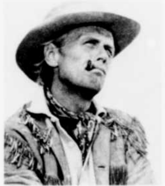
Cinéma nouveau d'hier et d'aujourd'hui mercredi 8, 23 h 30

Dans un premier temps, John Wayne détaille la psychologie individuelle et collective des personnages du drame, pour céder ensuite la place au rythme de l'épopée mené à fond de train. L'oeuvre est de plus une page mémorable de l'Histoire américaine, ce qui n'est pas pour nuire à la valeur du film.