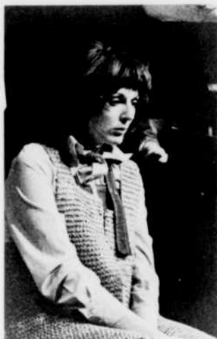
Cinéma canadien mardi 7, 23 h 30

N.B. Les téléspectateurs voudront bien prendre note que la dernière émission des Propos et confidences de Madeleine Renaud sera diffusé le samedi 4 août à 21 h 30.