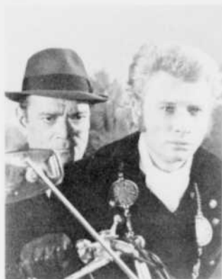
Les Grands Films jeudi 9, 19 h 30