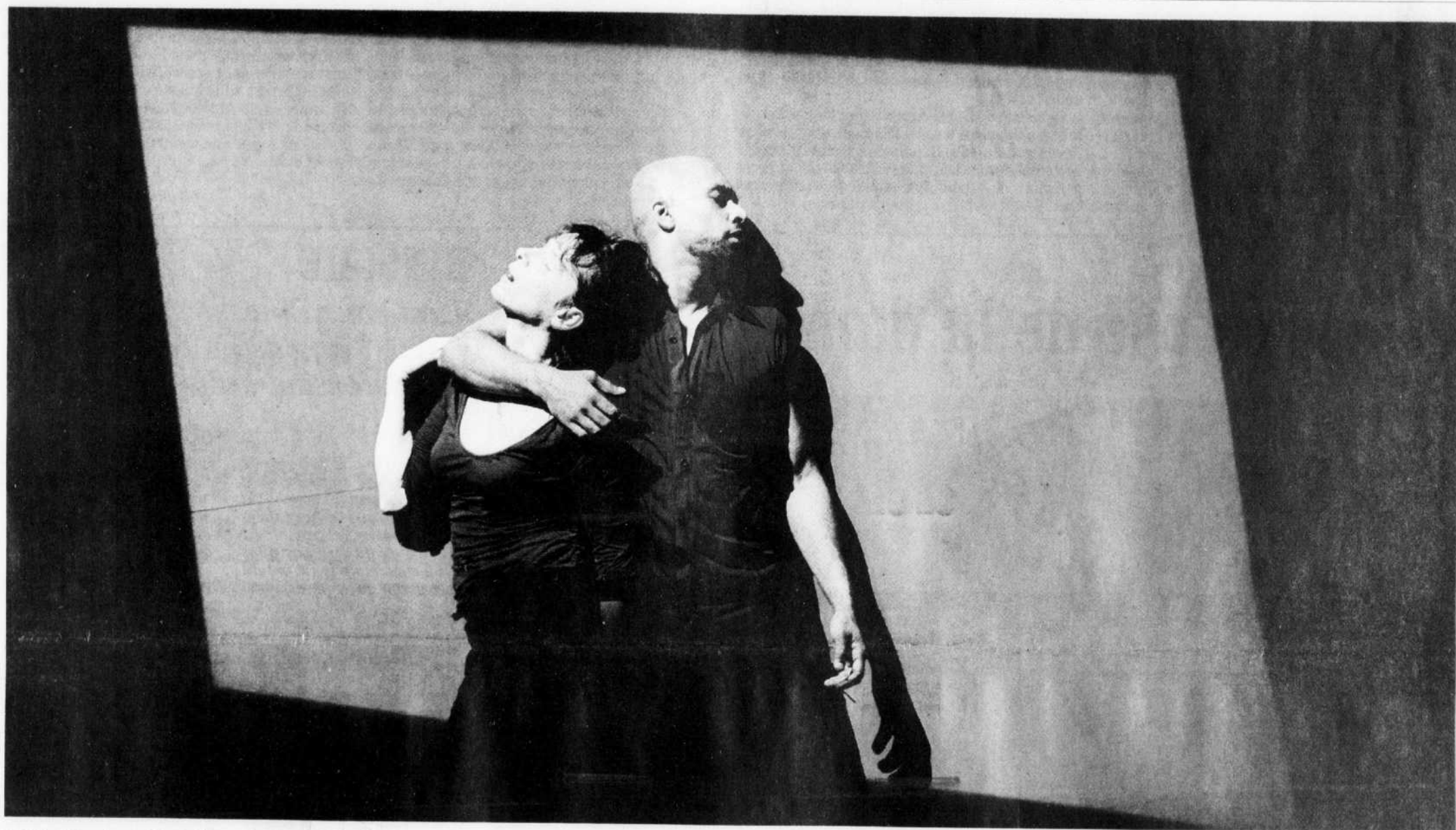
Juliette Binoche et Akram Khan dans In-I