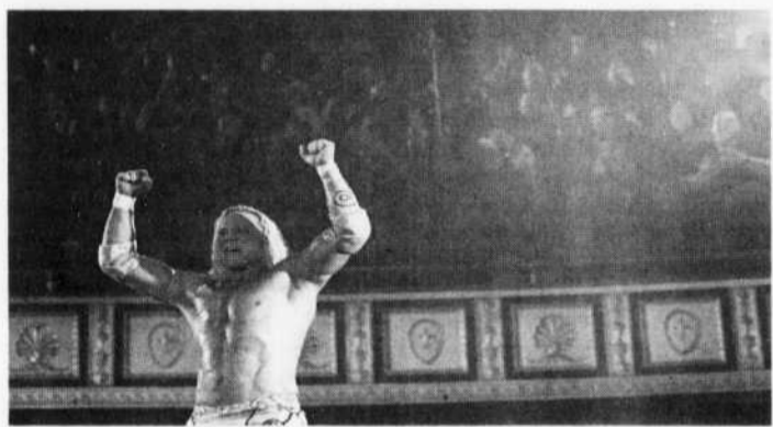
Une scène de The Wrestler , avec Mickey Rourke.