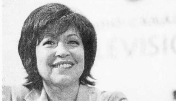
PERDÓ RUIZ LE DEVOIR

Le passage de Céline Galipeau à la barre du Téléjournal signe le grand événement de l'hiver à Radio-Canada.