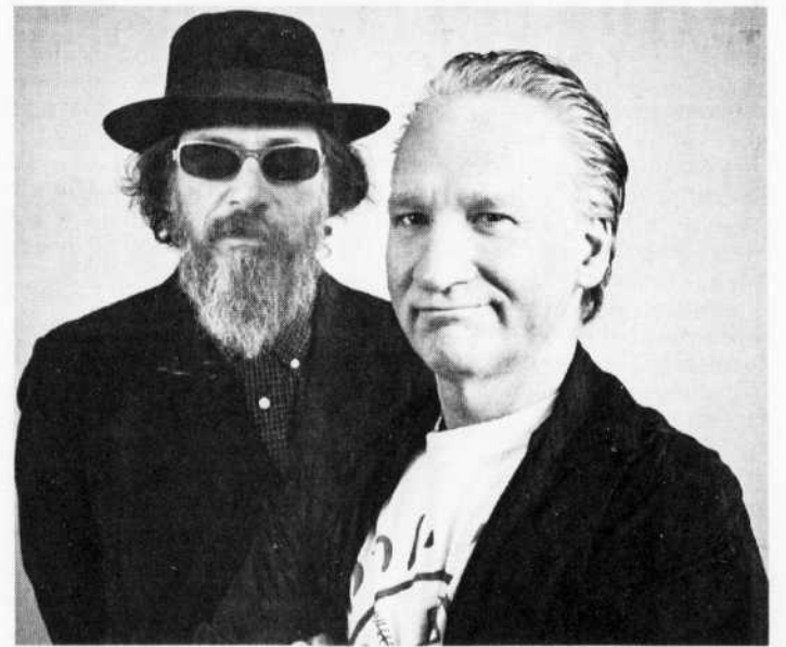
Le narrateur Bill Maher et le réalisateur Larry Charles, du film Religulous

Les documentaristes ne sont pas si différents. Certains débarquent avec leur caméra en faisant grand bruit et d'autres, à pas feutrés. Cette année encore, ils ont beaucoup voyagé, trainant dans leurs bagages leur vision du monde. C'est ainsi que Morgan Spurlock ( Where in the World is Osama Bin Laden? ) et Bill Maher ( Religulous ) ne s'effaçaient pas beaucoup durant leur périple respectif, le premier à la recherche de l'ennemi numéro un des États-Unis et l'autre en quête de réponses sur la ferveur religieuse exaltée de ses compatriotes. Dans les deux cas, beaucoup d'humour malgré la gravité des thèmes abordés mais une impression désagréable de sensationnalisme doublée de cette obsession pédagogique de lé-