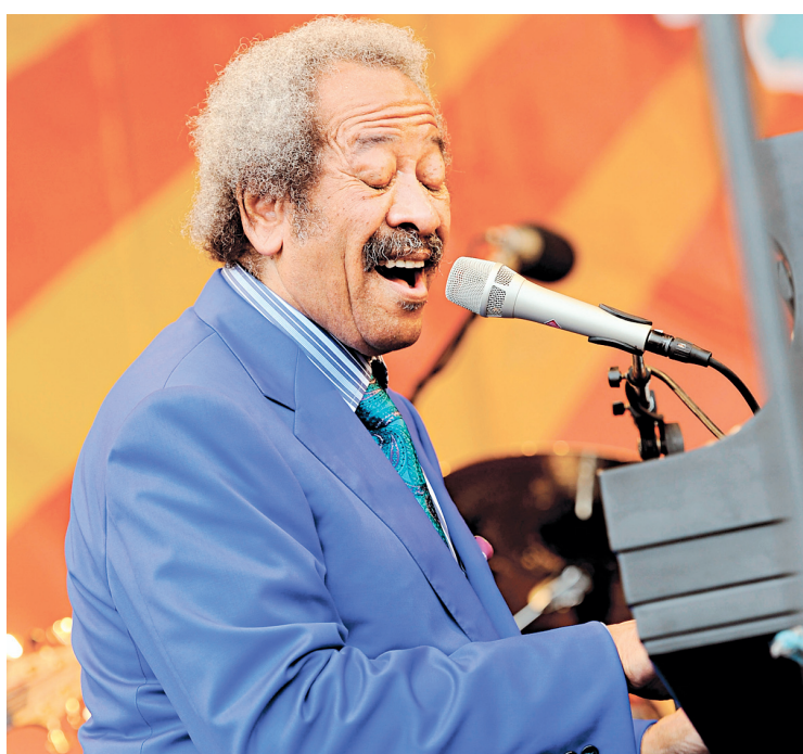
Allen Toussaint était en spectacle le 30 avril dernier au Jazz & Heritage Festival de La Nouvelle-Orléans. Il sera à Montréal cet été.

Dans la catégorie «on est très content qu'ils soient là», on a