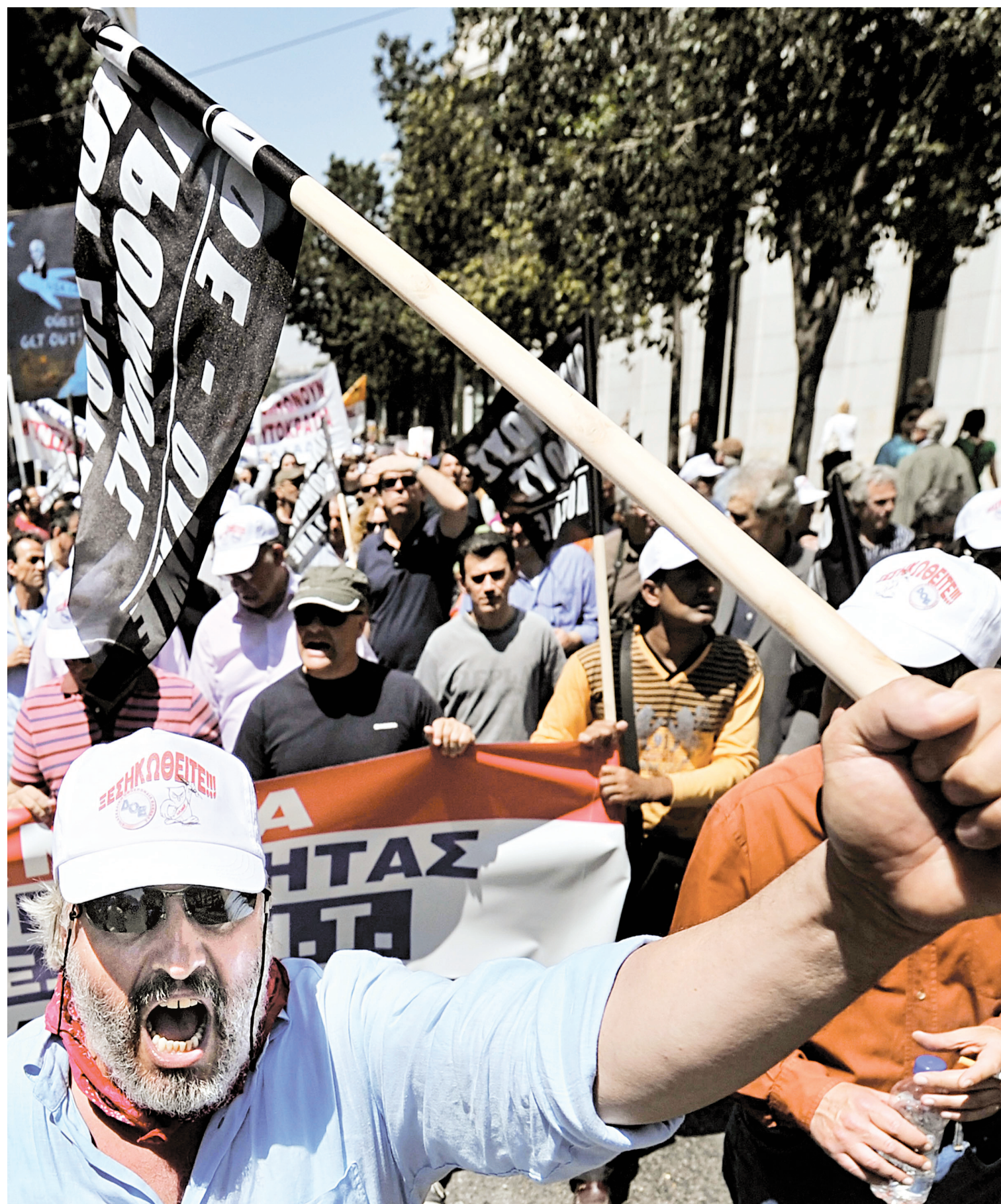
Des milliers de fonctionnaires ont manifesté hier devant le parlement d'Athènes afin de protester contre les mesures d'austérité annoncées pour permettre à la Grèce de bénéficier de l'aide de ses partenaires européens et du FMI.