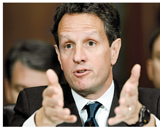
Timothy Geithner

Timothy Geithner a souligné que ce prélèvement aurait pour effet de décourager les banques d'accorder des prêts de manière inconsidérée.