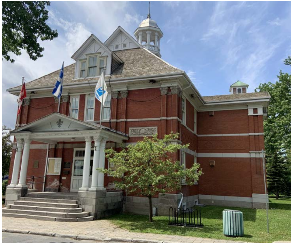
Le programme a pour objectif d'assurer une représentation équitable des personnes issues de groupes victimes de discrimination.

Dans le cadre de son processus de dotation et de promotion, la Ville de Chambly applique son Programme d'accès à l'égalité à l'emploi (PAÉE).