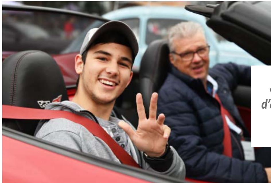
Cet événement a permis, depuis sa création, de rapporter plus de 1 M$.

permis, depuis sa création, de rapporter plus de 1 M$ à la Fondation Le Renfort pour assurer sa mission d'améliorer la qualité de vie des enfants et adultes vivant avec une DI ou un TSA. « C'est