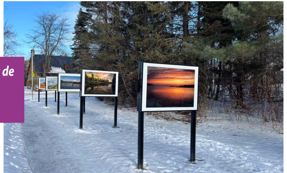
Le budget participatif propose, entre autres, une galerie d'exposition extérieure à l'année.

Culture Montérégie appuie le projet. « Permettre l'accès à la culture est