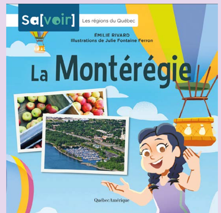
La Montérégie, œuvre d'Émilie Rivard.