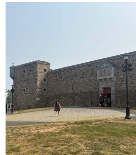
Le vrai fort Chambly.