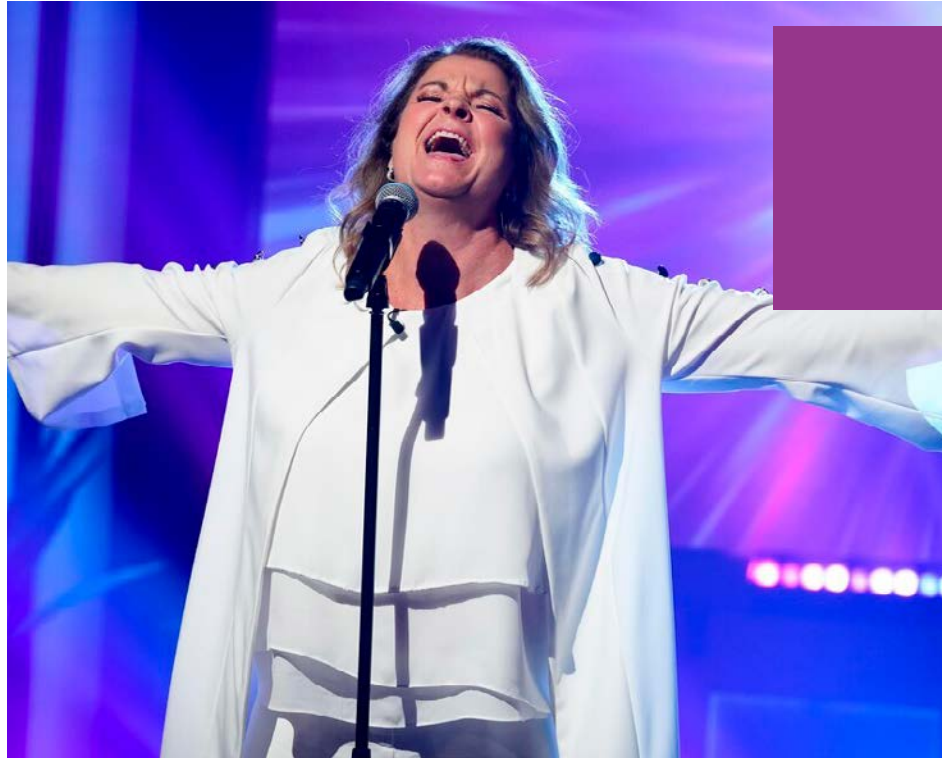
Jeanick Fournier avait eu droit au Golden Buzzer à son passage à Canada's Got Talent 2022.

Tournée, chants et sourires. La vie de Jeanick Fournier tourne autour de l'une de ses passions. « Ma vie a fait un 180 degrés. Je suis chanceuse de vivre ces moments à mon âge,