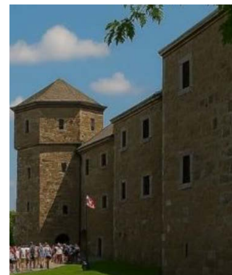
Le fort Chambly généré par l'IA ne reflète pas son aspect réel.

plus facile que ça élimine l'expérience acquise au fil des années », nuance-t-il.