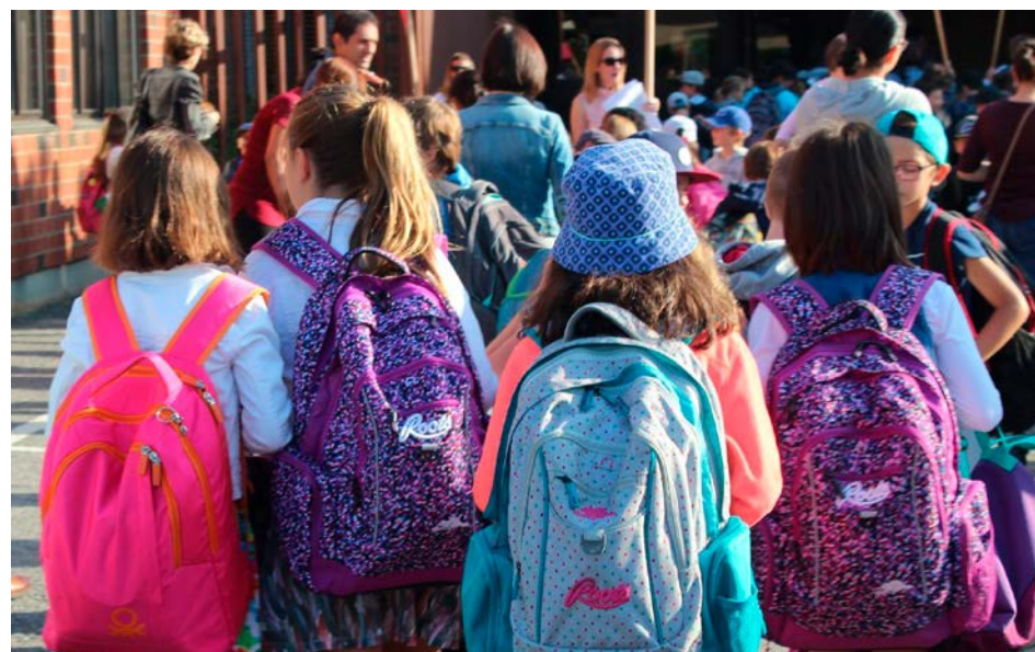
Qu'il s'agisse de manuels scolaires, d'un sac à dos, d'un étui à crayons, d'une calculatrice ou pour refaire sa garde-robe, plusieurs articles peuvent être achetés de seconde main.

Pour le matériel qui ne peut plus servir, plusieurs options écologiques sont à la disposition de la population pour s'en départir responsablement. Les stylos qui ne fonctionnent plus, les crayons feutres, les mines HB, les surligneurs, les vieux cartables et les calculatrices peuvent être déposés dans les boîtes