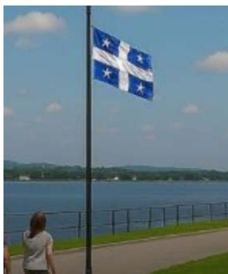
Dans la publication, le drapeau du Québec est plaqué d'étoiles au lieu de fleurs de lys.

j'ai un droit de critique en disant qu'il s'arrange pour faire mieux la prochaine fois ».