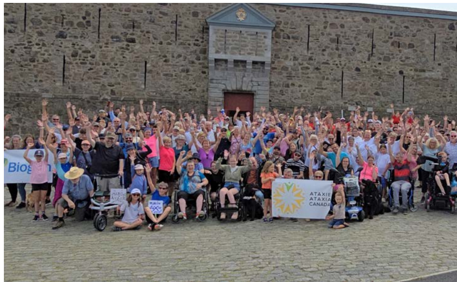
L'événement Défi Ataxie de Chambly a permis à la fondation d'amasser 100 000 $.

L'INESSS fait savoir que ses recommandations peuvent différer de celles de CDA-AMC en raison de