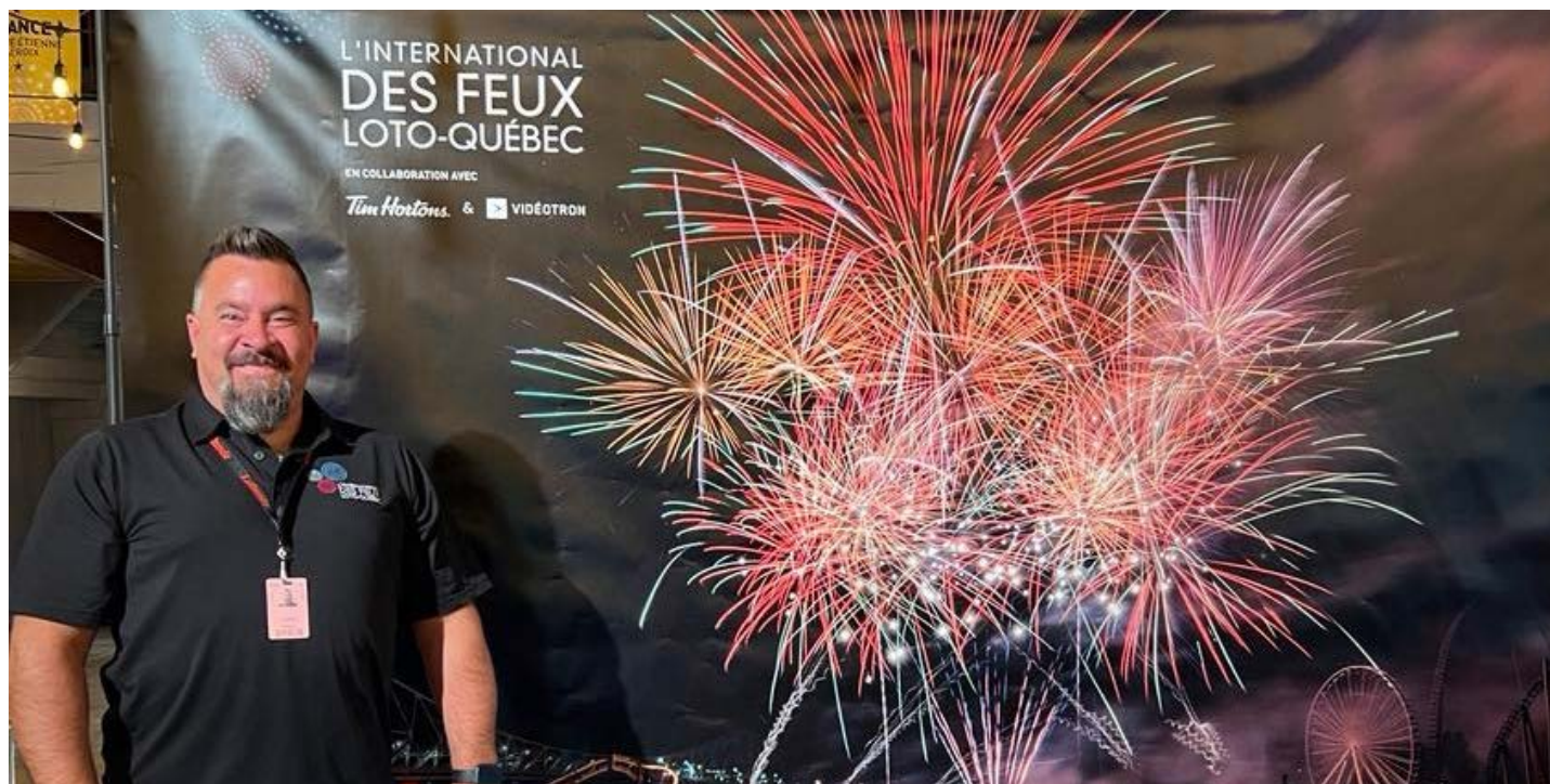
En tout, 19 personnes sont sélectionnées afin de composer le jury.

Il affirme que son sens critique s'est raffiné au fil de la progression des feux. « C'est fou comme tu ne regardes plus les feux comme avant. Tu remarques les erreurs ou les efforts », nuance-t-il. Les jurés ne peuvent pas se parler entre