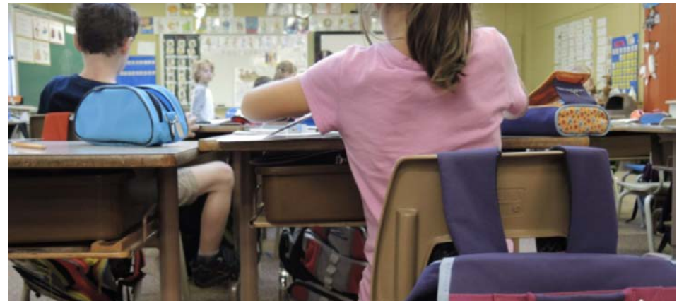
Le Code d'éthique a notamment pour objectif d'établir un guide de référence quant aux pratiques et aux conduites attendues à l'endroit des élèves.

Relativement à ce Code d'éthique « contemporain », adopté en avril dernier, Jean-François Guilbault mentionne ne pas avoir eu à représenter de membres s'étant exprimés de façon à déplaire à l'employeur. « Par le passé, on a eu des cas où l'on a dû représenter des enseignants qui se