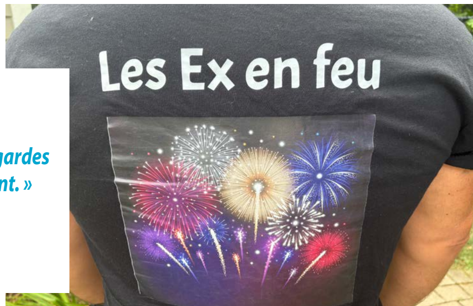
Une communauté nommée « Les Ex en feu » s'est tissée entre les anciens jurés et jurées.

« Avant tous les feux, ils effectuent un retour sur les évaluations précédentes