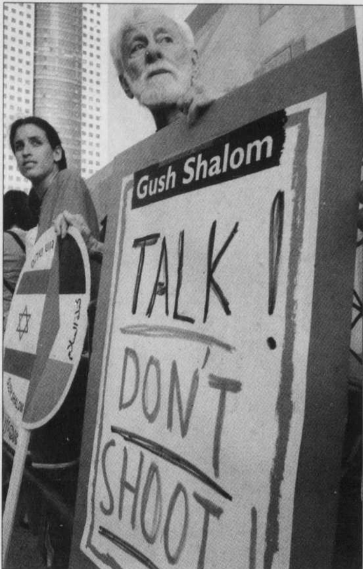
Des Israéliens de gauche ont manifesté hier devant le ministère de la Défense à Tel-Aviv pour dénoncer l'offensive de Tsahal en territoire palestinien.

Par ailleurs, plusieurs avions militaires ont survolé hier les palais du président syrien Bachar el-Assad pour avertir la Syrie qu'elle ne doit en rien soutenir les Palestiniens qui ont enlevé Gilad Shalit, a fait savoir l'armée israélienne.