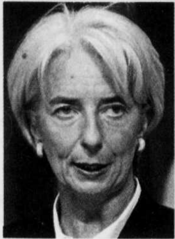
La ministre de l'Economie française, Christine Lagarde

Pour Gunther Capelle-Blancard, «on peut la croire». Pour lui, Fortis a été fragilisée par des «acquisitions hasardeuses», comme celle d'une partie d'ABN-Amro, et Dexia est «plus exposée aux prêts à risque américains que les autres banques à cause de son activité de rehausseur de crédit».