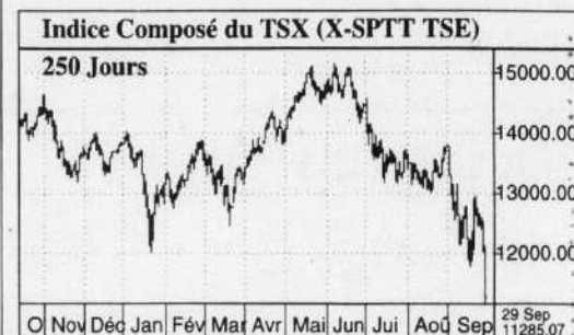
Indice Composé du TSX (X-SPTT TSE) 250 Jours