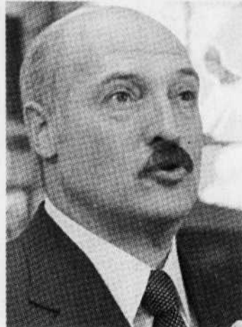
Alexandre Loukachenko

L'opposition bélaruse a conclu à une «défaite de la diplomatie européenne» dans ses pressions pour obtenir du président Alexandre Loukachenko des avancées démocratiques. Celui-ci avait fait quelques gestes avant le scrutin, libérant trois prisonniers politiques. Les candidats de l'opposition ont aussi eu un «accès légèrement accru» aux commissions électorales, plus de facilités pour tenir des réunions publiques et cinq minutes de temps de parole à la télévision à une heure de grande écoute, a noté l'OSCE.