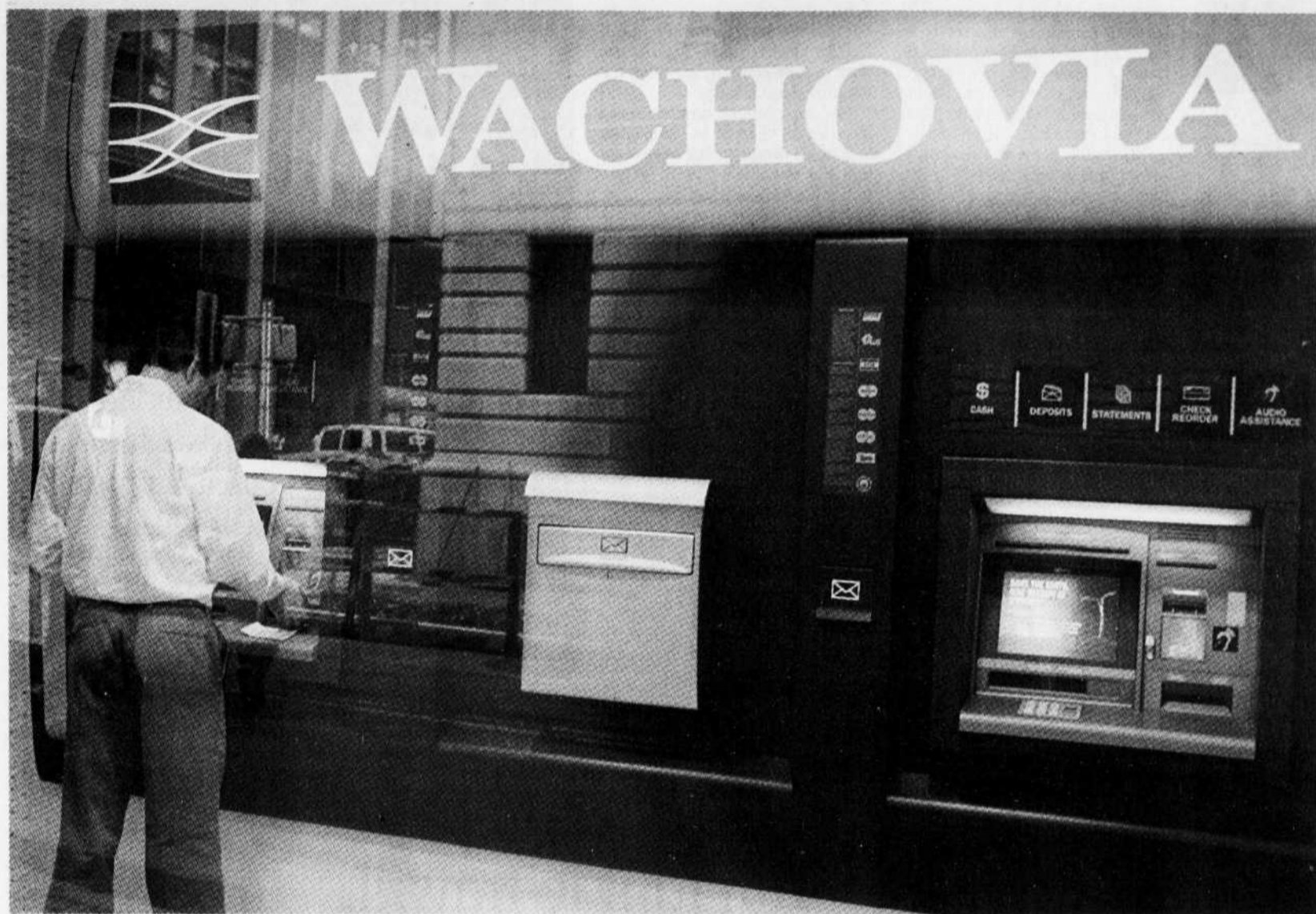
Un homme utilise un guichet de la banque Wachovia, à New York. Au bord de la faillite, Wachovia a été rachetée hier par Citigroup.