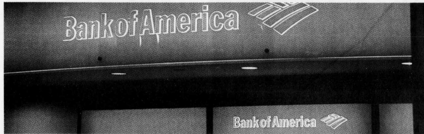
Une succursale de la Bank of America. Malgré la crise, l'institution américaine reste en tête par le nombre d'agences bancaires aux États-Unis (6 100) et par les dépôts (663 milliards de dollars).