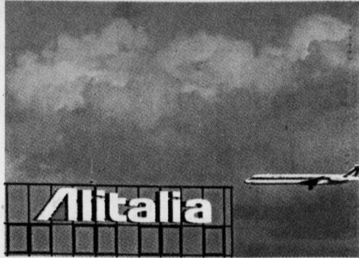
Un avion de la compagnie Alitalia atterrit à l'aéroport international Fiumicino, à Rome.