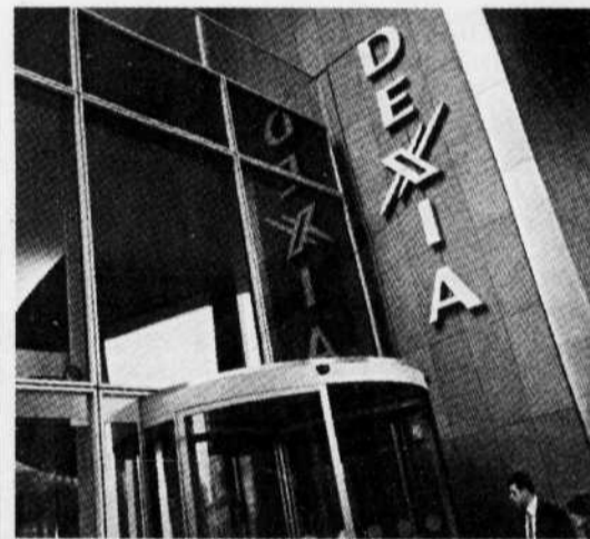
Siège social de Dexia, banque franco-belge, menacée de faillite