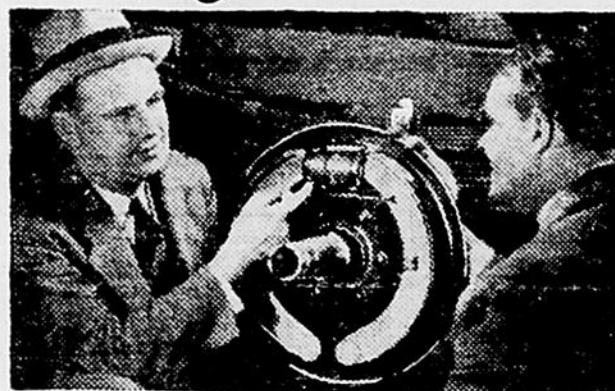
FREINS HYDRAULIQUES AUTHENTIQUES — Introduits par Dodge dans les camions de prix modiques. Arrêts sûrs et doux. Des épargnes en pneus et revêtements.

LES faits dépassent toujours les prétentions. Les propriétaires rapportent que "les Nouveaux Camions Dodge de 1937 établissent des nouveaux records de performance... qu'ils épargnent jusqu'à $8 et $10 par mois en essence seulement". Quand des propriétaires d'un océan à l'autre répandent des nouvelles semblables partout il n'y a pas à s'étonner si des milliers d'usagers se tournent vers les Camions Dodge. De sorte que avant d'acheter un camion, quel que soit la marque, il serait bon de vous bien renseigner sur les avantages offerts par Dodge. Vous trouverez chez Dodge une quantité de caractéristiques que vous ne rencontrerez nulle part ailleurs. Faites une comparaison minutieuse... ça vous paiera. Consultez l'agent Dodge-DeSoto le plus tôt possible.