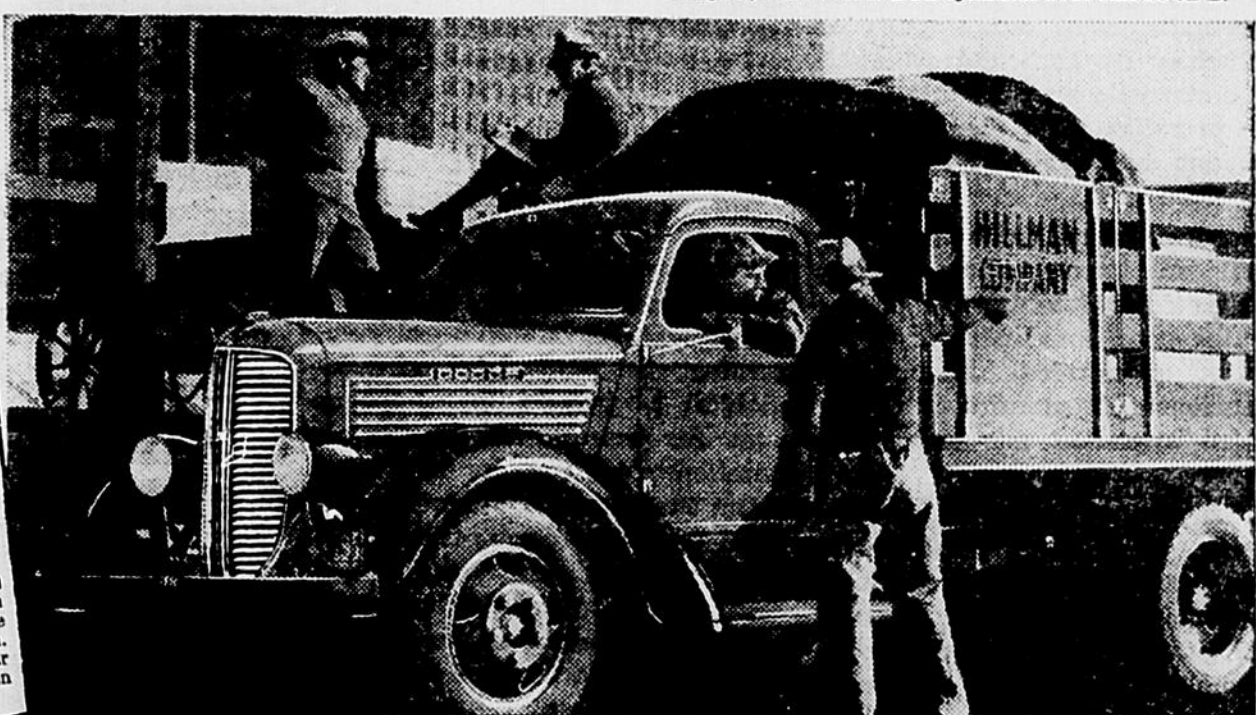
Nouveau Dodge 1937 à Ridelles de 1½ Tonne, 6-Cyl., Culasse en "L", 2 emplacements, Caisnes de 9' et 12'

Aux Ecoutes pour le Major Bowes, Réseau Columbia, tous les jeudis, 8 à 9 p.m., E.S.T.