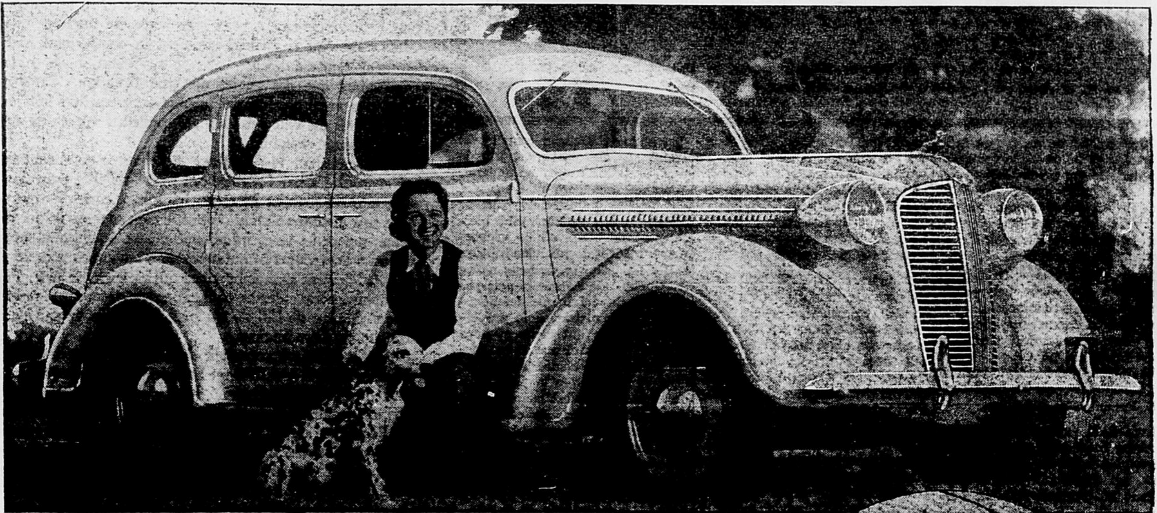
Dodge Custom Six, Sedan de Tourisme 4-Portes