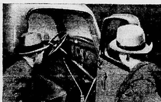
CABINE ACIER-SECURITE — Plus de sécurité et plus de confort. Cette cabine est construite pour une plus longue durée.