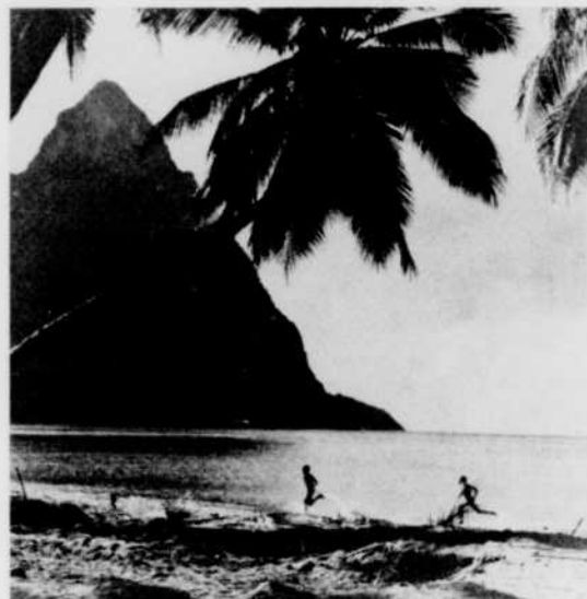
Un volcan éteint des Caraïbes.