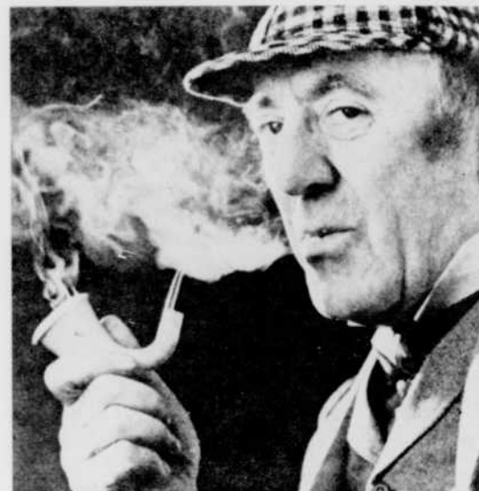
Basil Rathbone dans « Sherlock Holmes ».