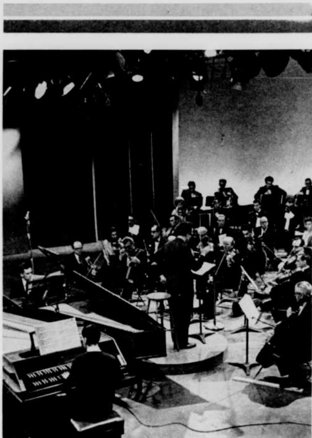
L'orchestre de Radio-Canada que l'on entend au cours de la série télévisée Concert, le dimanche après-midi.