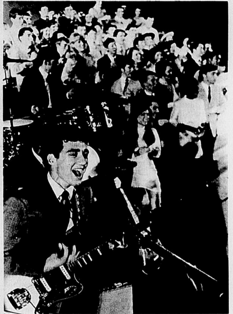
La grande troupe internationale de chanteurs et musiciens VIVE LES GENS donnera deux représentations dans la crypte de la Basilique du Cap, les 23 et 24 avril prochains. Un spectacle à ne pas manquer, unique en son genre. Nous y reviendrons.