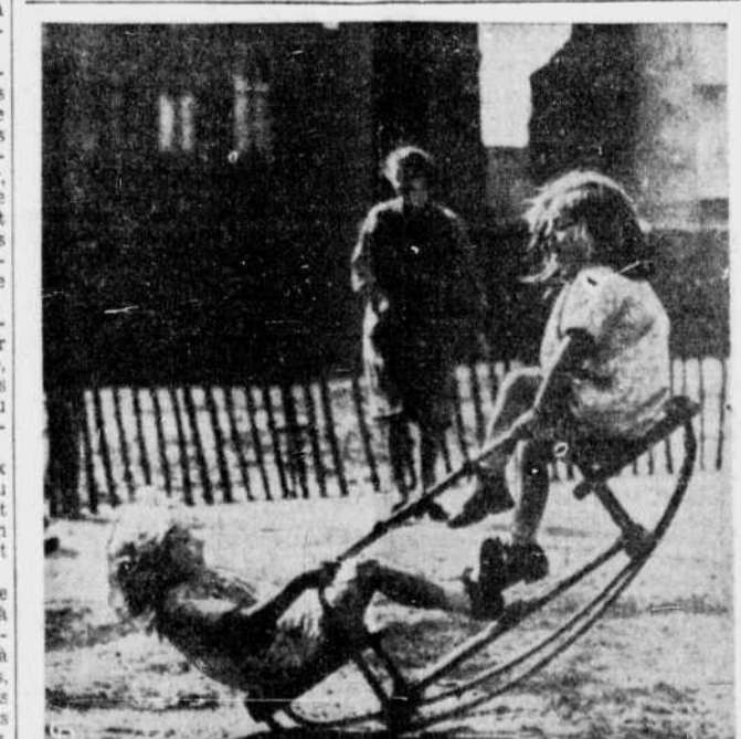
La vie reprend — Avec des squelettes d'édifices à demi démolis comme fonds de décor, les enfants de Londres reprennent leur vie normale dans un parc dont on a fait le déblayage des débris.