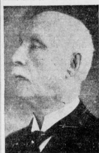
Sir Thomas CHAPAIS.

ST-DENIS-DE-KAMOURASKA, 15. (P.C.) — Sir Thomas Chapais, sénateur et leader du gouvernement à la Chambre haute du Québec, est décédé ce matin à sa résidence d'été. Il était âgé de 88 ans.