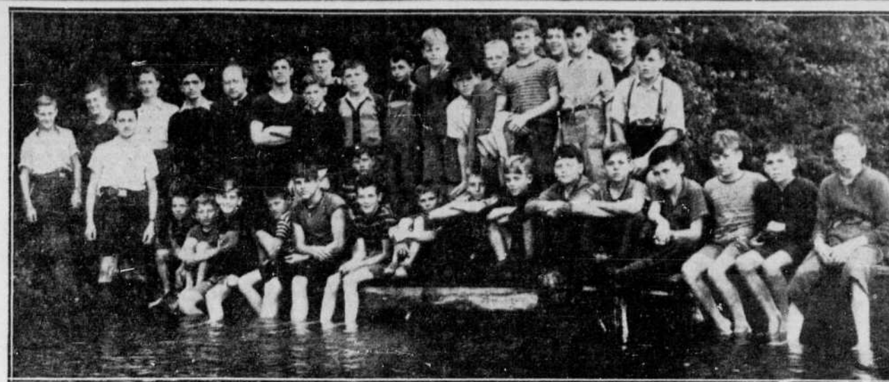
Camp scout au lac Nicolet — Depuis environ deux semaines, les scouts que nous voyons dans la photo ci-dessus jouissent du grand air et des bienfaits de la vie de camp sur les bords du lac Nicolet. Ce sont les scouts du quartier Ouest en compagnie de leur aumônier, leur soustremestre, leurs chefs de patrouille et leurs seconds. Les scouts durant la période du camp vivent intensément la vie scoutie telle qu'enseignée par Lord Baden-Powell, fondateur du mouvement, et durant la journée, certaines périodes sont consacrées à l'étude de différents sujets sur lesquels ils doivent ensuite passer un test pour obtenir leur insigne. Les principales insignes que reçoivent les scouts sont celles des premiers soins, des signaux (sémaphore et Morse), natation, cuisine, suivi de piste, etc. L'aumônier de la troupe, M. l'abbé Fernand Laroche, demeure avec les scouts durant toute la période du camp et célèbre la messe tous les matins.

Nous publions plus bas le programme des causeries agricoles qui seront prononcées à CHLT et à CKTS, au cours des mois de juillet et août, à chaque jeudi. On prie les cultivateurs et tous ceux qui s'intéressent à l'agriculture, de suivre ces causeries où ils trouveront beaucoup de profit. À CKTS, ces causeries seront prononcées à une heure de l'après-midi et à CHLT, à une heure 15, toujours heure avancée. On lira d'abord la date de la causerie, puis le sujet, le nom du conférencier à CKTS et celui à CHLT. Dans l'ordre chronologique, sont insérées aussi pour le lundi, la chronique de nos nouvelles agricoles: Le 15 juillet — Nouvelle agricole, J.-H. Bruneau, J.-H. Bruneau. Le 18 juillet — Office du rétablissement agricole des vétérans, W.-G. Robinson, H. Brunelle. Le 22 juillet — Nouvelles agricoles, W.-G. MacDougall, D. Salvas. Le 25 juillet — Vallées, L.-A. Gnaedinger, P. Galarnaud. Le 29 juillet — Nouvelles agricoles, W.-S. Richardson, L.-P. Thibodeau. Le 1er août — Présentation d'animaux, W.-G. MacDougall, J.-A. Lambert. Le 5 août — Nouvelles agricoles, L.-E. Beaudin, Jean Martin. Le 8 août, Cercles de veaux, G. Maroux, G. Maroux. Le 12 août — Nouvelles agricoles, D.-J. MacMillan, R. Scott. Le 15 août — Chaux, M. Finn, L.-P. Thibodeau. Le 19 août — Nouvelles agricoles, P. Gervais, P. Gervais. Le 22 août — Mouton, R. M. Elliott, R. M. Elliott. Le 26 août — Nouvelles agricoles, W.-G. MacDougall, J.-A. Ste-Marie. Le 29 août — Expositio n de Sherbrooke, Conférencier spécial.