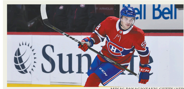
MINAS PANAGIOTAKIS GETTY/AFP