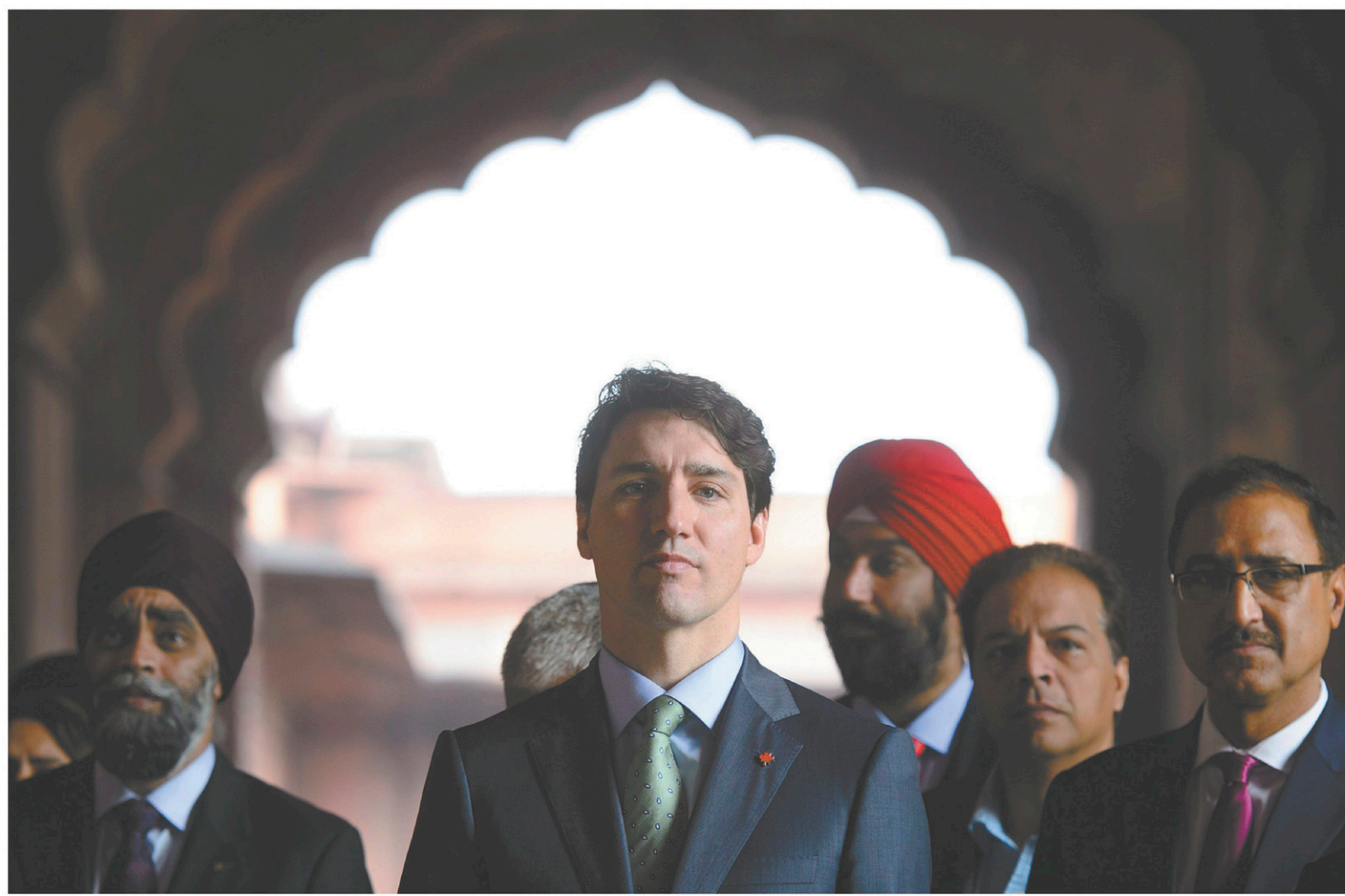
Justin Trudeau a notamment visité la mosquée Jama Masjid de New Delhi, jeudi.