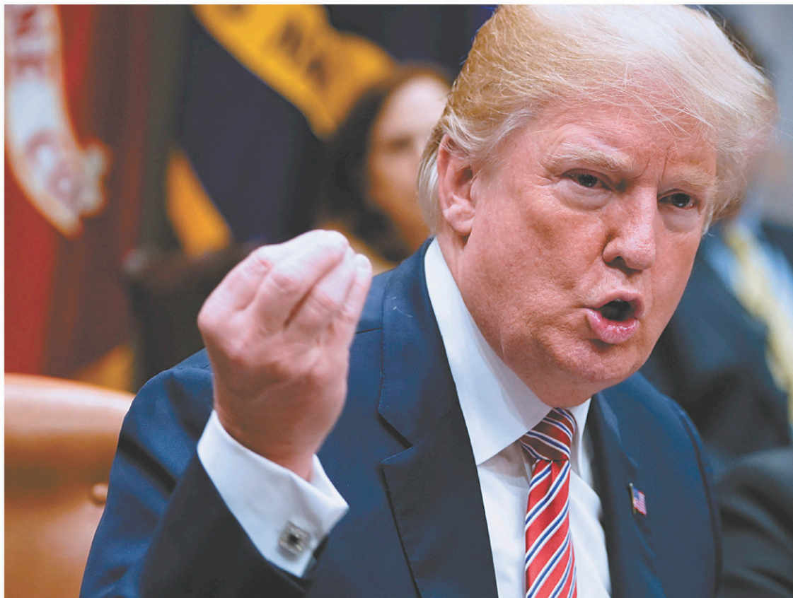
Le président américain a évoqué de possibles « bonus » pour les enseignants qui porteraient une arme en salle de classe.

Scott Israel, shérif du comté de Broward où se trouve Parkland, a annoncé jeudi que l'un de ses adjoints était en poste, armé et en uniforme, au