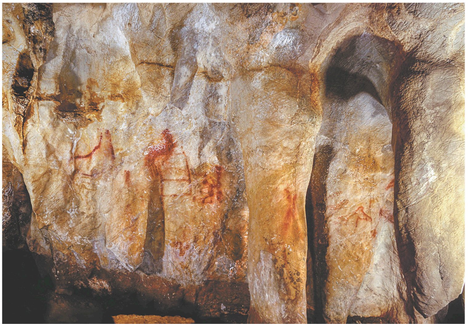
Les formes rouges tracées par des Néandertaliens sur cette paroi de la caverne La Pasiega remontent à plus de 64 000 ans.