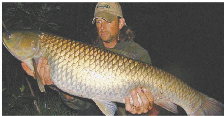
La carpe de roseau peut atteindre une taille impressionnante, comme celle-ci, pêchée en Allemagne, mesurant 97 centimètres.

Preuve du sérieux de la menace pour les cours d'eau du sud du Québec, le ministère a augmenté substantiellement l'aire couverte par le programme de