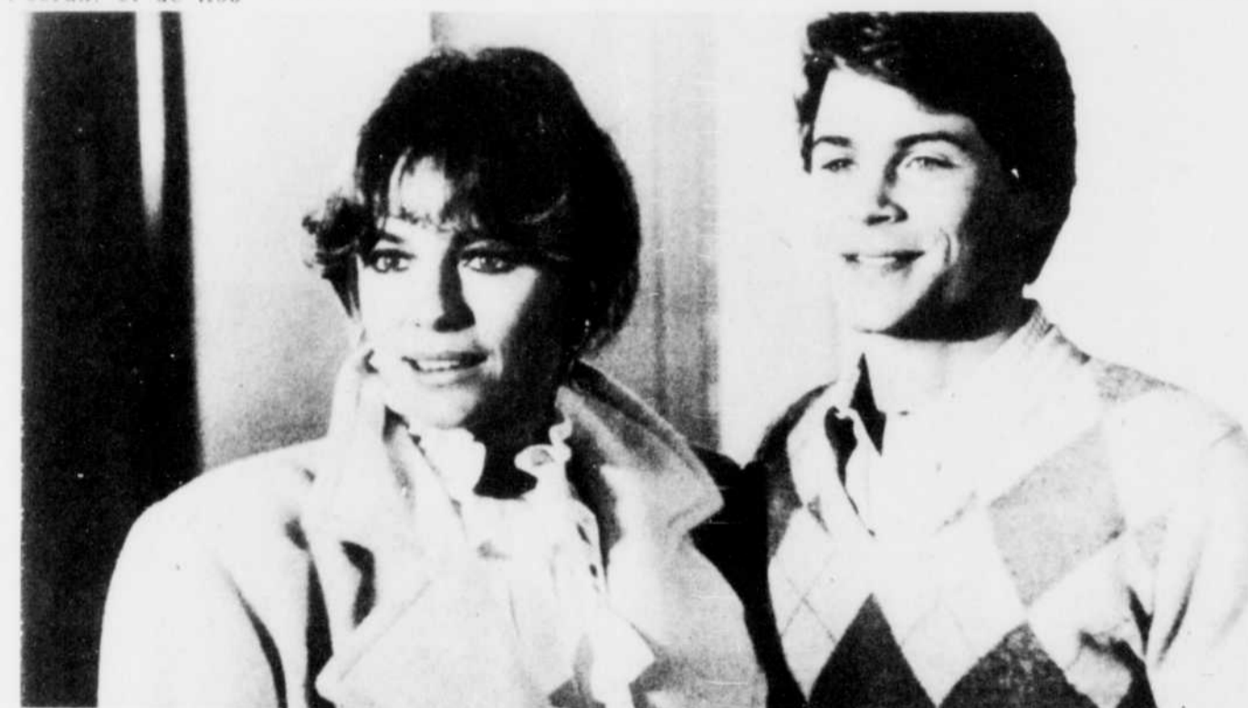
Jen (Jacqueline Bisset) et son jeune ami, le collègue Jonathan (Andrew McCarthy), dans une scène de "Class".

Jamais, jusqu'à ce jour, Jacqueline Bisset n'a oublié ce conseil.