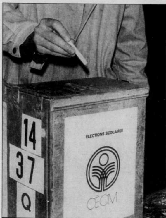
La faiblesse relative de la participation doit être replacée dans une perspective historique plus large.

Le transfert incomplet des électeurs anglophones a eu pour effet de gonfler artificiellement la liste francophone et de tronquer la liste anglophone. Le calcul des taux de participation, qui établit le rapport entre les voteurs effectifs (ceux qui ont exercé leur droit de vote) et les voteurs potentiels (ceux qui auraient pu le faire), est ainsi tendancieux et les conclusions faussées.