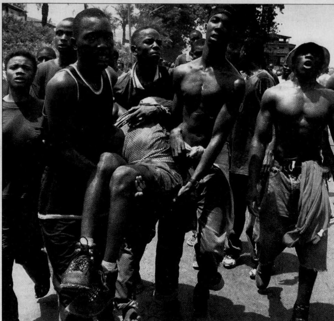
Plusieurs dizaines de milliers de personnes ont manifesté hier à Freetown pour réclamer la paix.