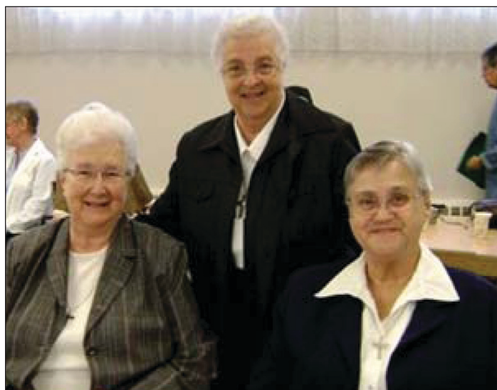
Estrie, mai 2012

Après un bon moment de pique-nique au bord de l'eau, sous un thermomètre de 29°, nous avons vécu une riche sororité dans ce « Maillon d'aide » qui soutient des femmes blessées. En après-midi, nous sentant en symbiose avec celles-ci, la religieuse psychothérapeute-responsable nous a fait part de ses responsabilités de même que des innombrables heures de présence qu'elle et sa compagne octroient à ces femmes souvent vidées et anéanties au profond de leur être. Ce centre d'hébergement, sans but lucratif, se veut une réponse aux besoins d'ordre physique, moral et psychique par l'écoute attentive et un encadrement sécurisant.