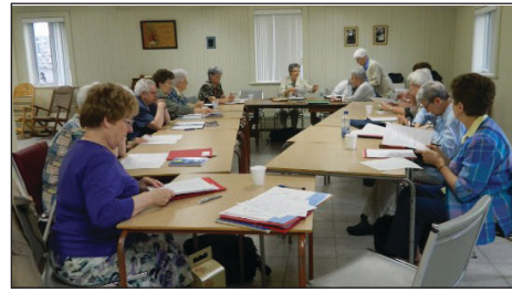
Saint-Damien, juin 2012

La deuxième partie de la journée a revêtu un caractère festif en harmonie avec les vacances à venir. La visite du Centre historique des sœurs de Notre-Dame-du-Perpétuel-Secours a suscité l'admiration de toutes et a permis une découverte de leur déploiement au Québec et dans d'autres continents.