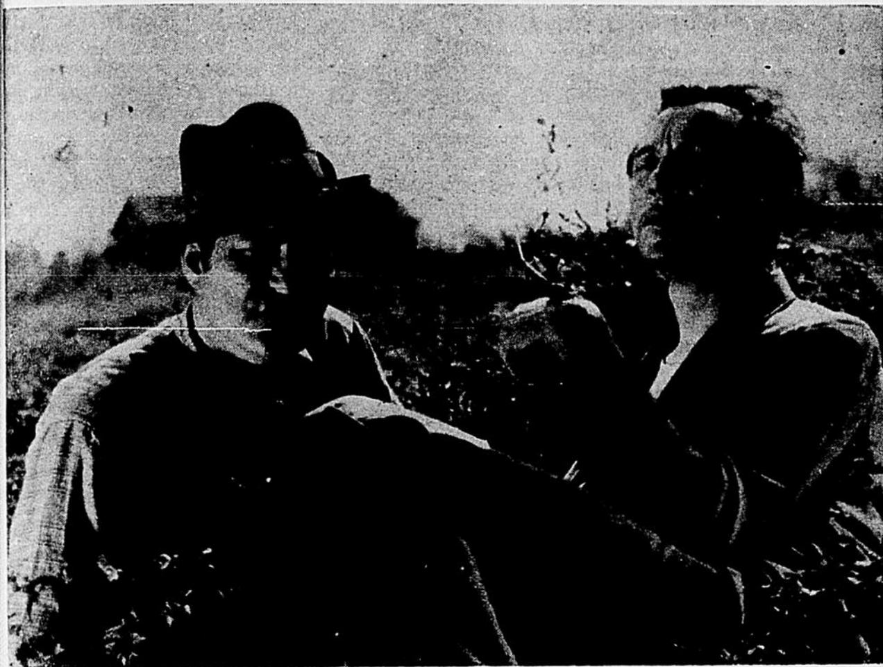
« Les Bas-fonds » (1936), d'après Gorki. Film que les cinéphiles ont déjà eu l'occasion de voir...