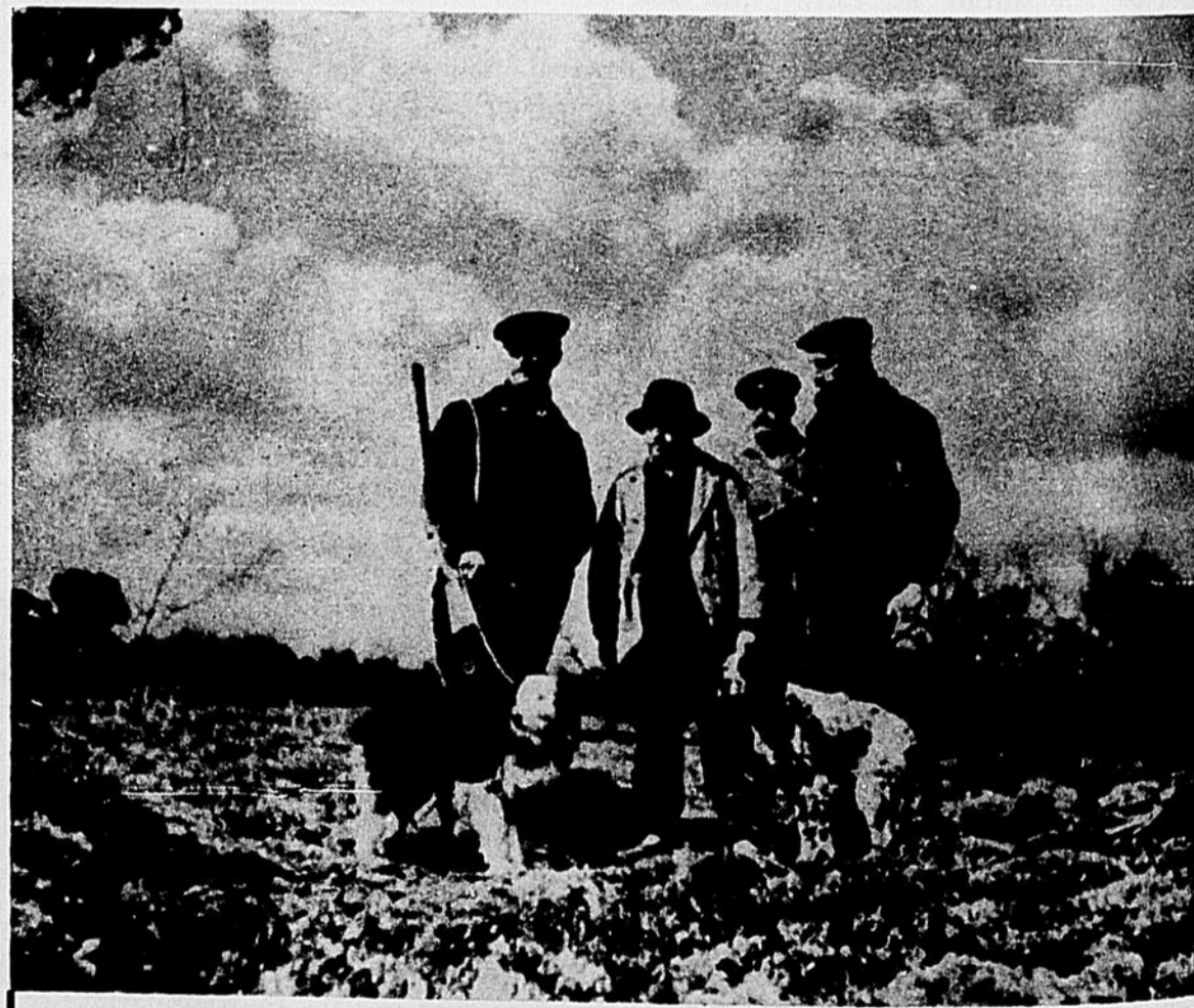
La fameuse partie de chasse. Morceau d'anthologie ! Cruauté du massacre. « Jeu » qui aura sa réplique plus tard dans la poursuite où les chasseurs deviendront gibier...

(Première représentation, vendredi soir le 18 à 9 h. 30)