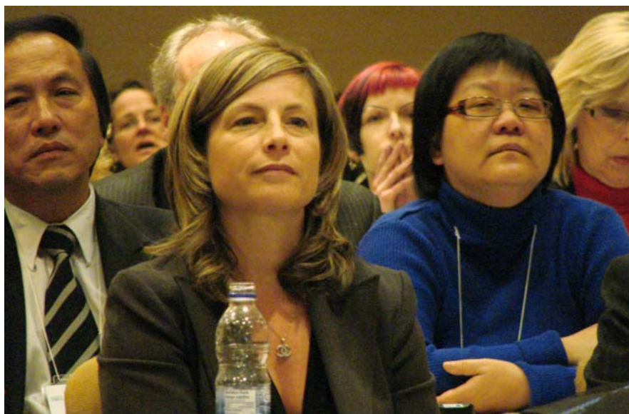
Les personnes présentes au Forum ont pu voter électroniquement sur les priorités et les stratégies proposées par l'Agence. La grande majorité des participants ont beaucoup apprécié leur journée.

Le lundi 29 mars dernier, l'Agence de Montréal a consulté son réseau d'établissements ainsi que l'ensemble de ses partenaires afin de leur soumettre les priorités et les objectifs de la Planification stratégique montréalaise 2010-2015. Au terme de la journée, on peut affirmer que les grandes orientations du plan ont reçu un accueil favorable de la majorité des participants.