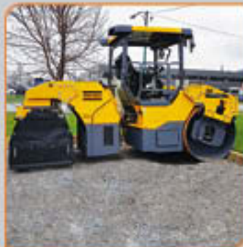
Rouleau Dynapac CC4200 combi 2017 48 pouces/65 pouces Prix de vente 179,000$