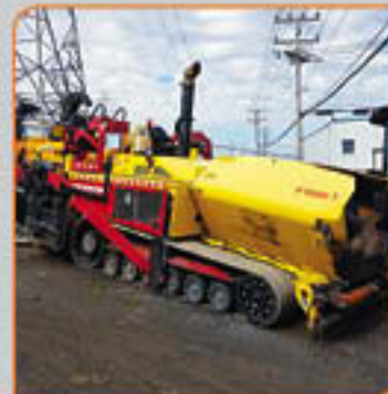
Paveuse Dynapac F1000T 2012 10 à 20 pieds Prix de vente 295,000$