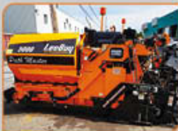
Paveuse LeeBoy 5000 5 à 9 pieds Prix de vente à partir de 108,000$