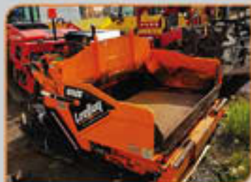
Paveuse à gravité LeeBoy 1000G 2016 8-13 pieds Prix de vente 95,000$