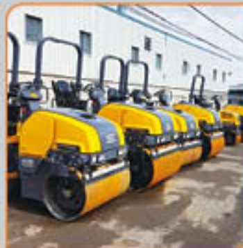
Plusieurs rouleaux de 35 à 51 pouces disponible Prix à partir de 25,000$