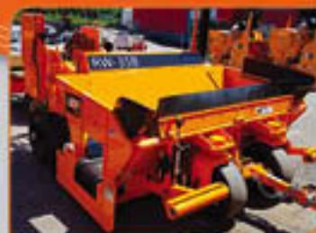
Élargisseur de rue LBP RW35B 2017 Prix de vente 125,000$