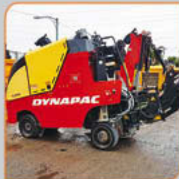
Planeuse Dynapac PL500TD 2013 150 heures Prix de vente 159,000$