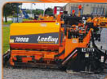
Paveuse LeeBoy 7000 8 à 13 pieds Prix de vente à partir de 105,000$