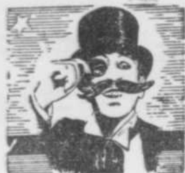
— PAR — L'ACADEMIEN