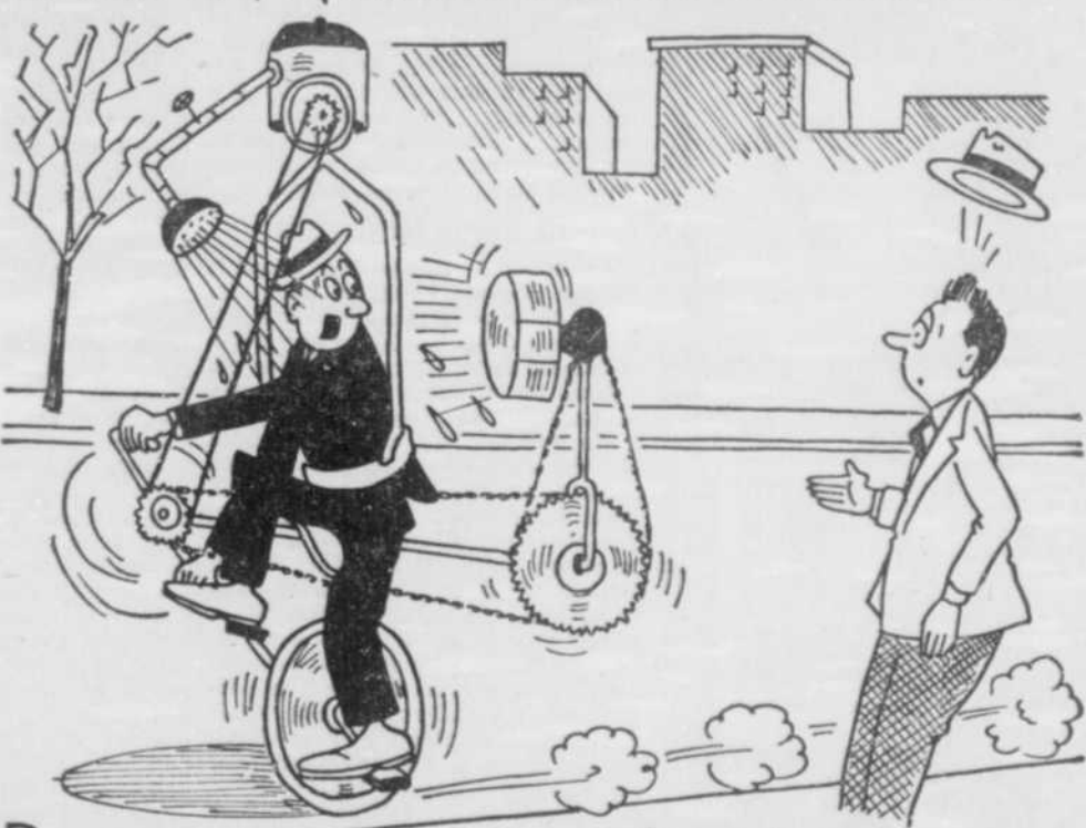
POURRIEZ-VOUS ME DIRIGER VERS LE POSTE CKAC? JE POSSÈDE UNE INVENTION QU'«ALAIN GRAVEL» POURRAIT DÉCRIRE AU PROGRAMME «QUOI DE NOUVEAU?»?