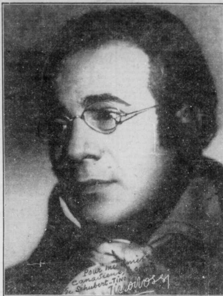
Voici une photographie de TINO ROSSI extraite du film qu'il vient de tourner en France, et dans lequel il interprète le rôle de Schubert. On peut y lire: "Pour mes amis Canadiens, le salut de Schubert-Tino".

Et c'est sur cette évocation du Canada, qu'il aime tant, que nous nous séparons.