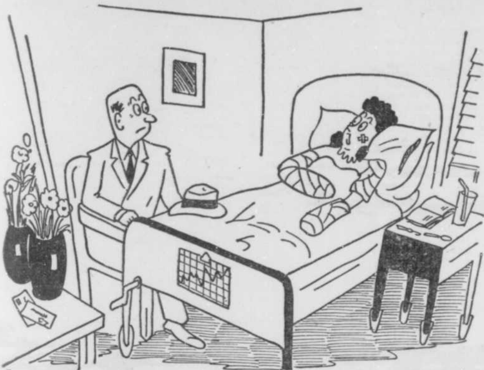
LA PROCHAINE FOIS QUE J'IRAI ASSISTER AU PROGRAMME DU «P'TIT TRAIN DU MATIN» A RADIO-CANADA, J'ESPÈRE QUE TU M'ACCOMPAGNERAS!