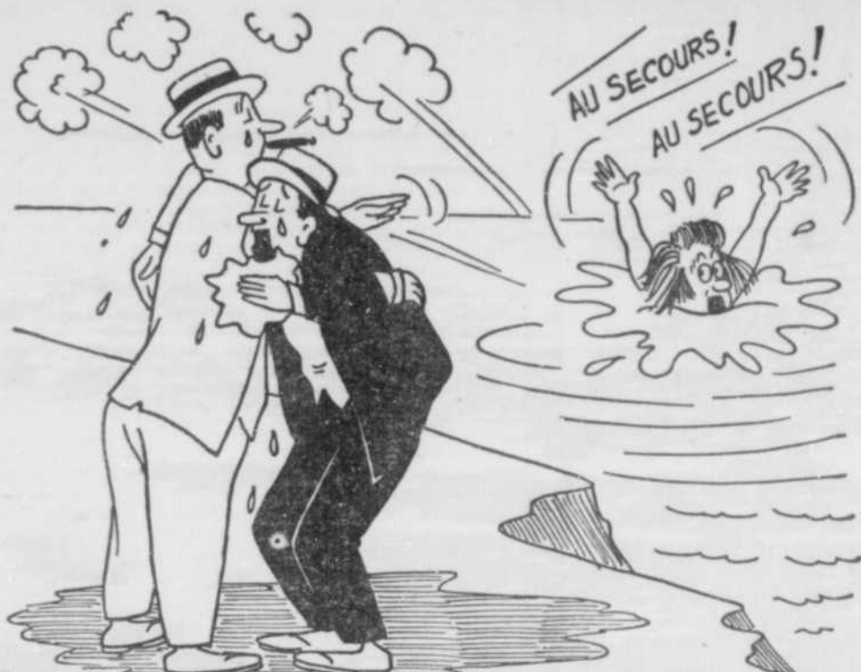
EXCUSEZ MON ÉMOTION, CHER AMI, MAIS SI MA FEMME ENFONCE UNE TROISIÈME FOIS, ... ÇA VA M'FAIRE MANQUER «LE BAL DE LA RADIO»!