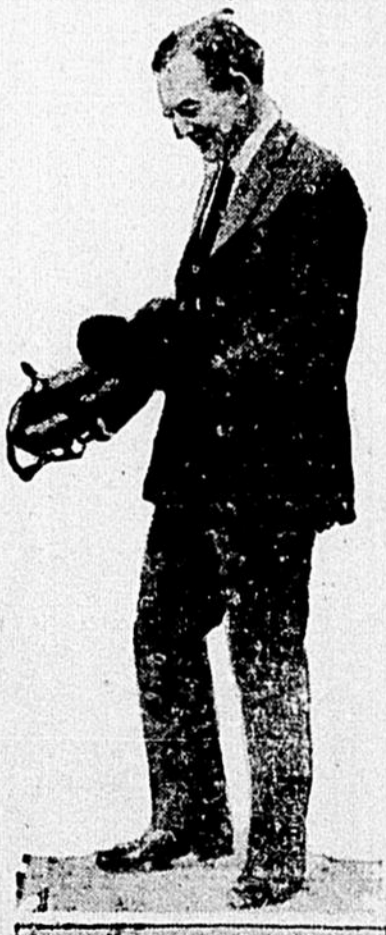
Miller Huggins, gérant des Yankees de New-York. On le voit examinant un masque et un gant avant de les remettre au receveur des Yankees au camp d'entraînement de St. Petersburg, Fla.