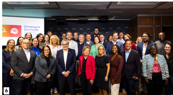
6. Participantes et participants à l'activité de lancement du 25 septembre 2024.