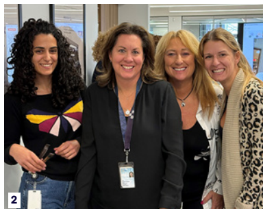
2. Repas-partage du CEETSE.