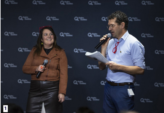
1. Les responsables de l'animation de la soirée.