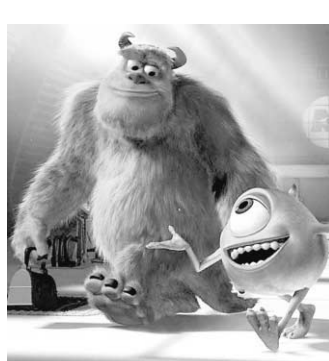
Monstres inc. ( Monsters Inc. ) continue son succès monstrueux.

Le film a franchi la barre des 100 millions samedi, neuf jours après sa sortie, établissant un nouveau record pour un dessin animé : Toy Story 2 , en 1999, avait mis 11 jours pour franchir la barre.