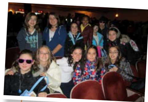
Les élèves de l'école primaire Pierre-Elliott-Trudeau de Blainville.

À l'instar des treize autres municipalités accréditées Municipalité amie des enfants (MAE) au Québec, la Ville apporte son soutien au bien-être et aux droits de l'enfant entre autres par la promotion de la Journée nationale de l'enfant. ■