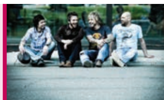
Kaïn 11 janvier - 20 h TLG