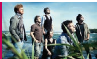
Mes Aïeux 22 décembre - 20 h TLG