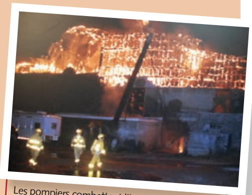
Les pompiers combattant l'incendie faisant rage sur le plateau de tournage du film Rollerball .

En effet, la municipalité a accueilli le tournage de films tels que The Whole Nine Yards avec Bruce Willis et Matthew Perry (1999), Battlefield Earth , avec John Travolta (1999) ainsi que Rollerball , mettant en vedette LL Cool J et Jean Reno (2000). À ce propos, l'incendie du plateau de tournage, dans un dépôt situé à l'angle de la 37 e Avenue, avait d'ailleurs créé tout un émoi. Une cinquantaine de pompiers de Blainville, Sainte-Thérèse, Boisbriand et Mirabel avaient mis deux heures pour éteindre le brasier.