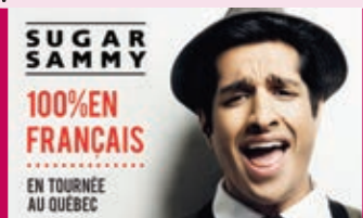
Sugar Sammy 19 et 20 janvier - 20 h TLG

Ciné-Groulx vous présente une programmation surprenante de films et documentaires.