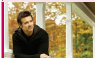
Roch Voisine 13 janvier - 20 h TLG