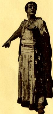
QUO VADIS Petrone