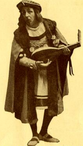
LES MAITRES CHANTEURS Beekmesser