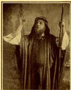
L'ENFANT PRODIGE Le père