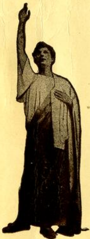
QUO VADIS Petrone