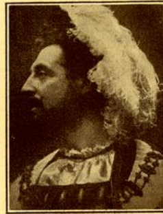
ASCANIO Benvenuto Cellini

« Son succès dans « QUO VADIS », est éclatant. Il le doit à cette maîtrise du beau chant, mise au service d'une ample traduction, rehaussée de toutes les nuances qui comporte l'expression exacte et pittoresque et qui communique la lumière et la flamme. Cet artiste remarquable est en pleine possession de son art, maître de ses moyens et des ressources d'une sensibilité profonde, dirigée par l'expérience. »