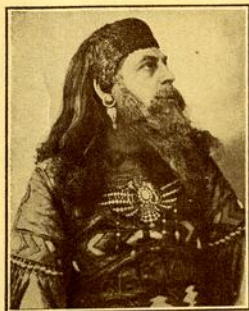
SAMSON ET DALILA Grand prêtre