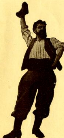
LE CHEMINEAU Le Chemineau