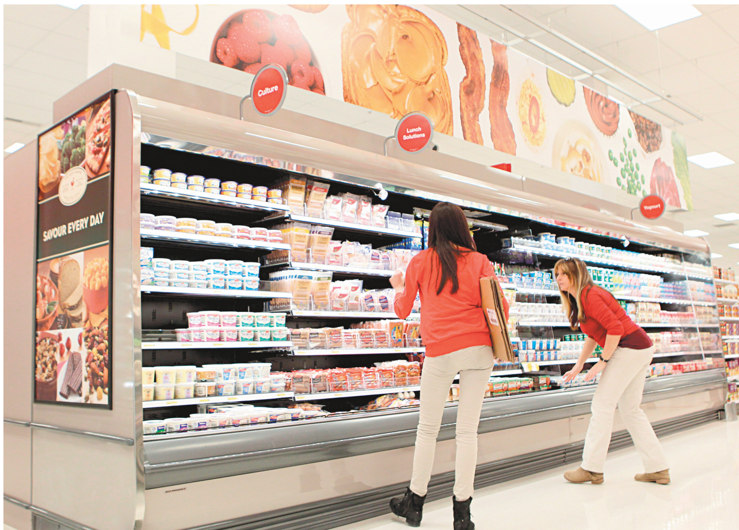
Deux employées du détaillant américain Target disposent des produits dans un comptoir réfrigéré, à Guelph.