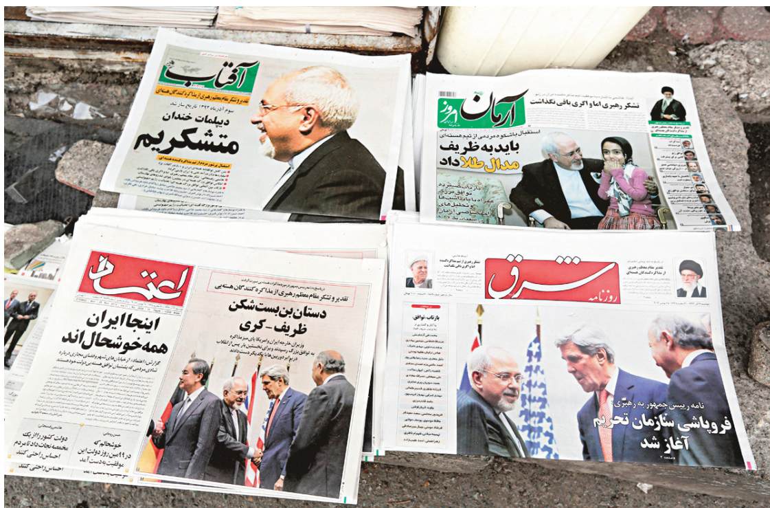
Les quotidiens iraniens ont tous fait leur manchette lundi avec l'accord sur le nucléaire.

De son côté, Israël, qui a vivement reproché à la communauté internationale d'accepter que l'Iran enrichisse de l'uranium, est entré dans une séance d'explications avec son grand allié américain. « J'ai parlé hier [lundi] avec le président Obama et nous sommes convenus que dans les prochains jours une délégation conduite par le conseiller à la sécurité nationale Yossi Cohen se rendra aux États-Unis pour discuter de l'accord final avec l'Iran », a déclaré au Parlement