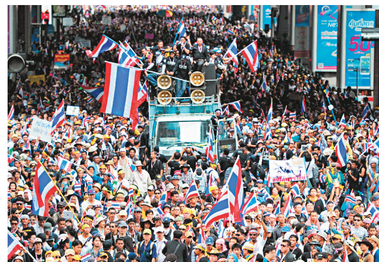
Les manifestants lundi à Bangkok