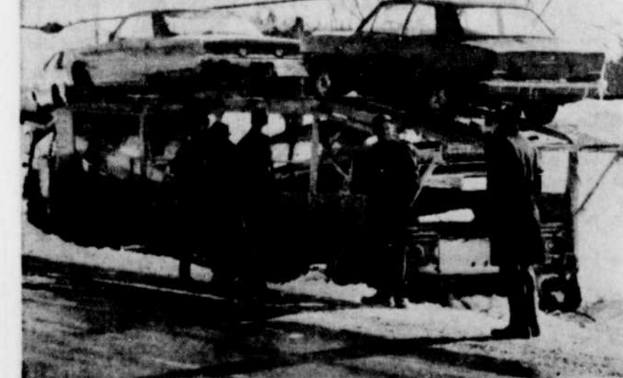
UN BLESSE? — Une personne aurait été blessée hier avant midi, dans les environs de Richmond, lorsque deux autos se sont frappées face à face. Cette remorque transportant des automobiles a dû prendre le fossé. Il a été impossible d'apprendre plus de détails.