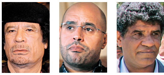
Mouammar Kadhafi, son fils Saïf Al-Islam et le chef des renseignements, Abdallah Al-Senoussi, recherchés pour crimes contre l'humanité.

À Bruxelles, le secrétaire général de l'OTAN, An-