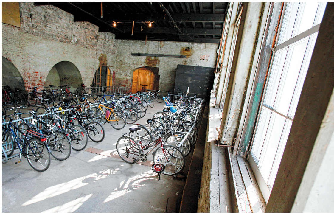
À défaut d'avoir trouvé un usage aux nouvelles casernes, on y loge les vélos du personnel de l'Hôtel-Dieu de Québec.

Alors, les nouvelles casernes restent dans le coma. À l'intérieur, on a empilé les portes et des