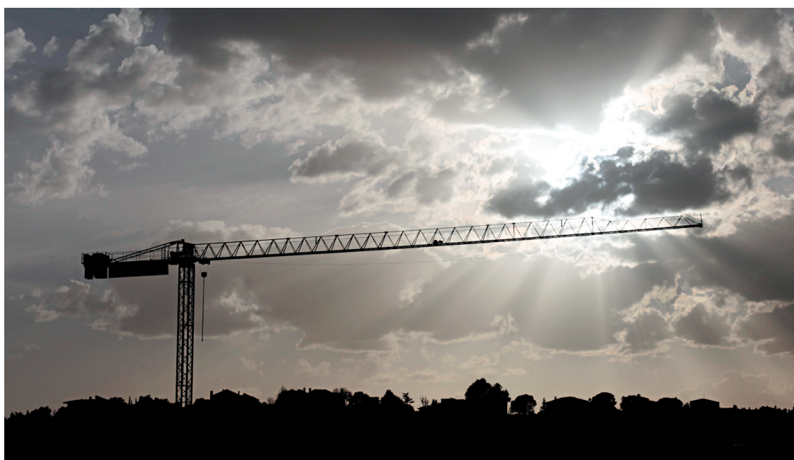
Un sondage mené auprès du monde de la construction révèle que le quart des travailleurs et employeurs ont été témoins de gestes de corruption ou de collusion.